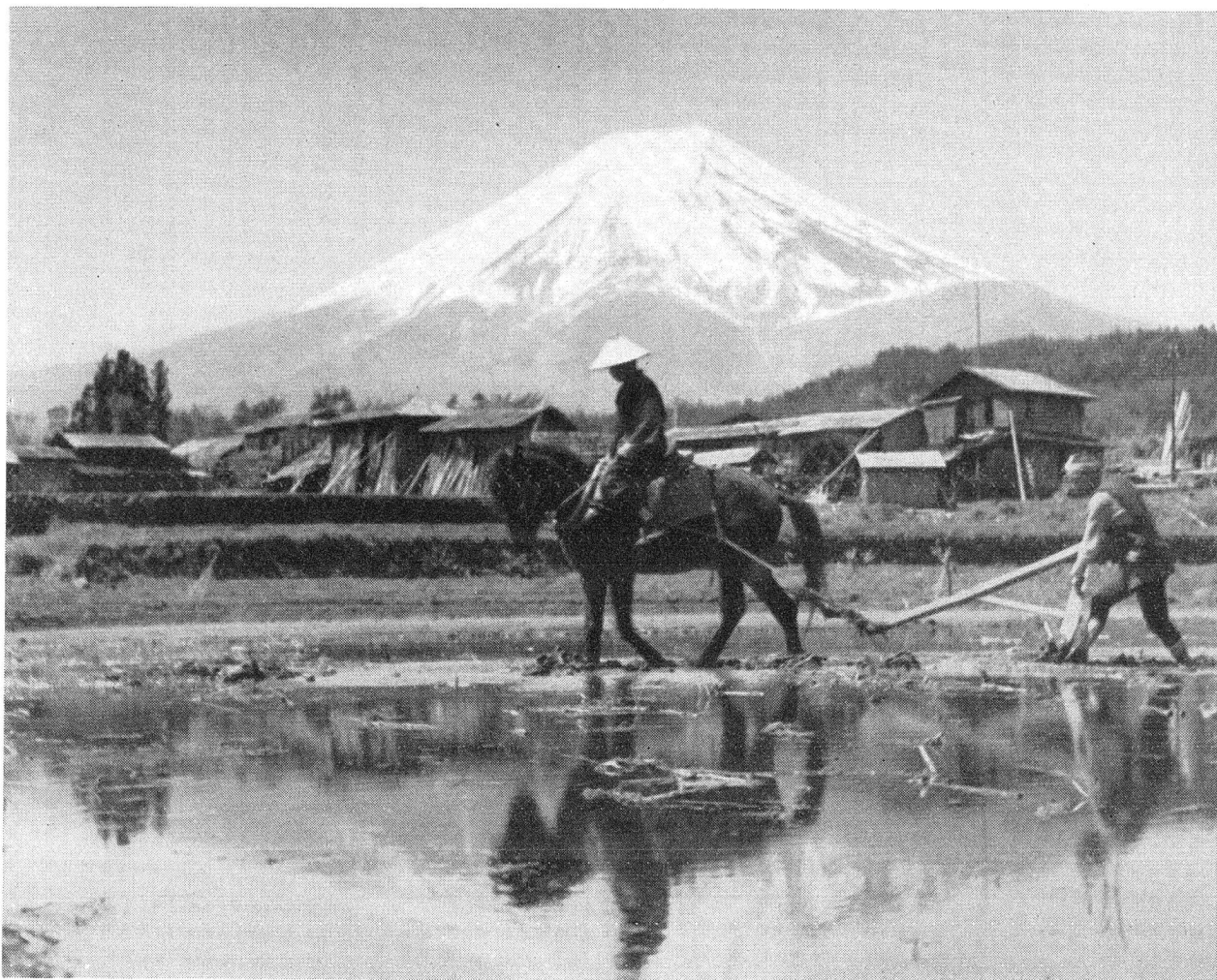
Die Reisfelder Japans sind terrassenförmig an den Berghängen angelegt. Der unter Wasser liegende Acker wird gepflügt. Im Hintergrund der Fujiyama.