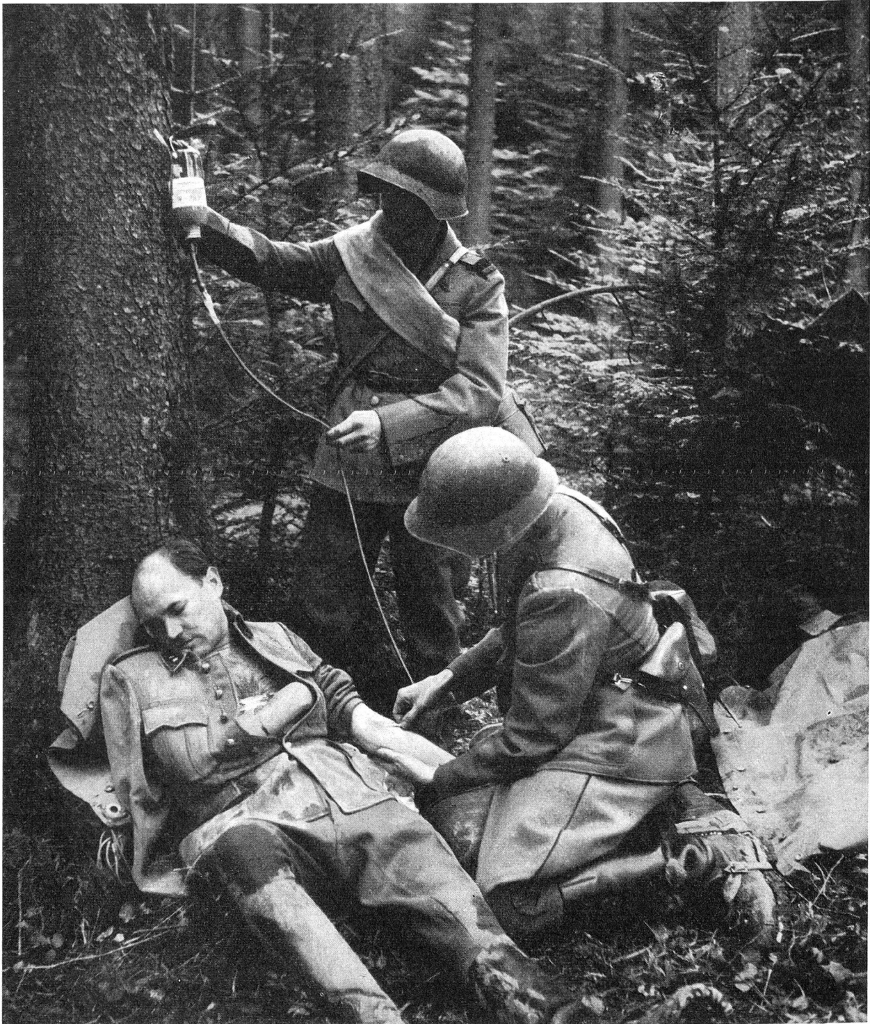
Plasmatransfusion anlässlich einer sanitätsdienstlichen Übung. Die Plasmaflasche wurde mittels eines Militärmessers am Stamm einer Tanne befestigt.

Es ist richtig, dass man sich an der Front im