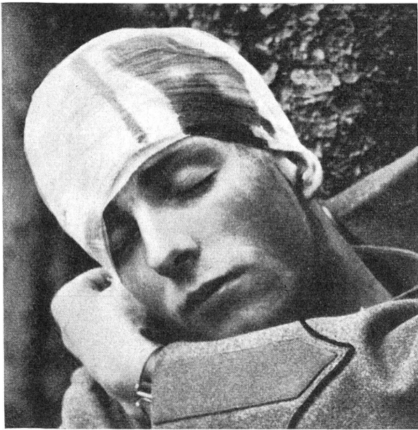
Ein «verwundeter» Schweizer Soldat anlässlich einer sanitätsdienstlichen Uebung.