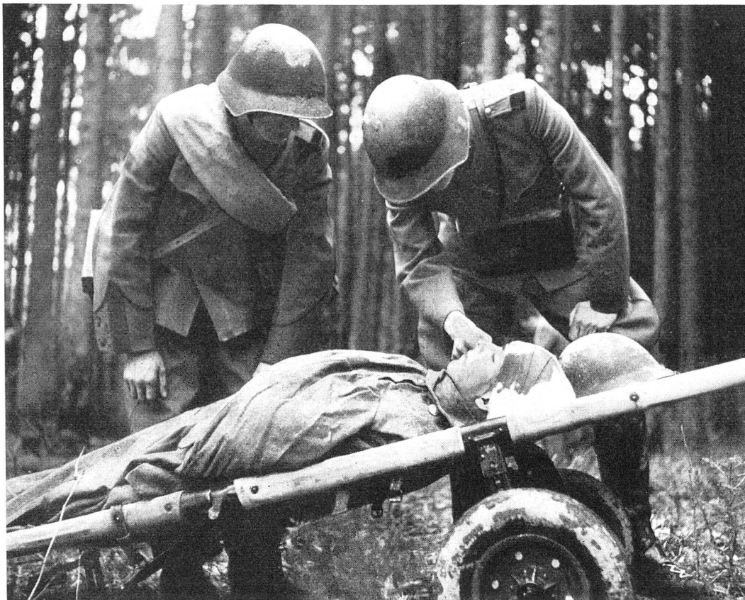
Ueberprüfung des Verbandes an einem «Schwerverwundeten» durch einen Militärarzt und Anordnung einer Plasmatransfusion.

allgemeinen auf Plasmatransfusionen und Infusionen von künstlich hergestellten Blutersatzflüssigkeiten beschränken muss. Vollbluttransfusionen spielen dagegen eine sehr grosse Rolle in den chirurgischen Feldspitälern und in den Militärsanitätsanstalten (MSA).