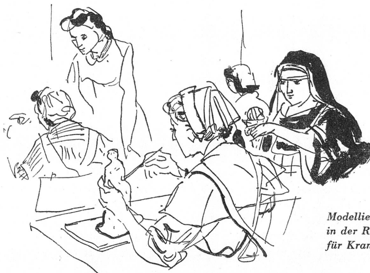
Modellieren in der Rotkreuz-Fortbildungsschule für Krankenschwestern.

Die gemeinsamen Besprechungen sollen in regelmässigen Abständen wiederholt und Ausschüsse aus dem Kreise der Anwesenden zur Bearbeitung der verschiedensten Fragen bestimmt werden. Der Kampf gegen den Schwesternmangel wird mit dem Erlös der Weihnachtsglocken und Kugeln, die das Schweizerische Rote Kreuz im Christmonat in unserem ganzen Lande zum Verkauf anbieten lässt, finanziert. Mit dem Kauf dieses mit dem roten Kreuz versehenen Weihnachtsschmucks hilft jedermann mit, dem künftigen Kranken — wer weiss, ob nicht sich selbst! — die einwandfreie Pflege zu sichern.