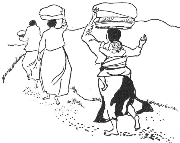
Skizzen von Warja Honegger-Lavater

«Oh, wie schrecklich war es», sagte er, als er endlich wieder aus dem Wasser kam. Er hatte auch nie mehr den Wunsch, im Wasser unterzutauchen.