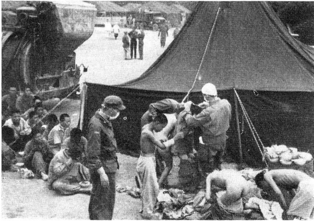
Bild links: Vor dem Entlausungszelt im schwedischen Hospital. Die verwundeten Kriegsgefangenen harren in Gruppen der Entlausung, bevor sie den verschiedenen Abteilungen des Spitals zugewiesen werden.