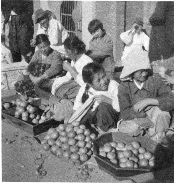
Markt in Pusan.

eignete sich ein Autounfall nach dem andern. Man fand schliesslich heraus, dass die Koreaner möglichst nahe an die fahrenden Autos herangingen, damit ihr böser Geist überfahren werde. Immer noch leben die Lehren des Konfuzius und des Buddha in Korea, wenn auch nur in kleinerem Aus-