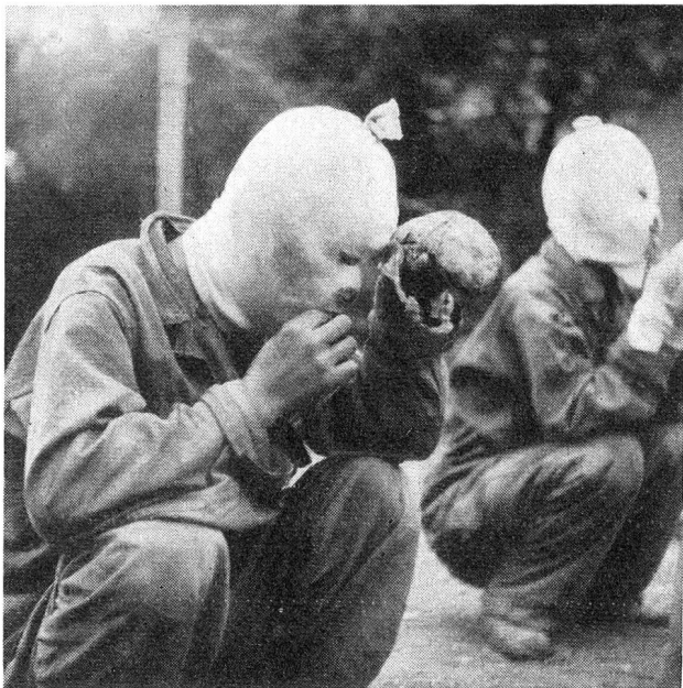
Bild links: Zwei mit schweren Verbrennungen verwundete Kriegsgefangene. Sie tragen Gipsverbände.