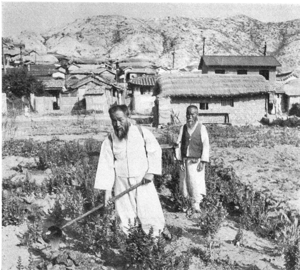
Ein Aussenquartier von Söul mit zwei typischen Koreanern: Bärtiges Gesicht, weisse Kleidung.

Ja, wann werden sie wieder aufbauen können? Vorläufig wird immer noch vernichtet.