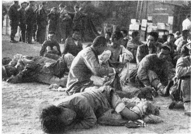
Bild rechts: Im Hof des schwedischen Spitals. Eingelieferte verwundete Kriegsgefangene.