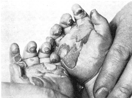
Ausgedehnte Verbrennungen beider Hände eines Kindes...

Swiss American Corporation, 25 Pine Street, New York Credit Suisse (Canada) Ltd., 360 St. James Street West, Montreal