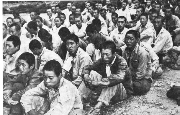
Nordkoreanische Kriegsgefangene warten auf den Abtransport in ein Lager.