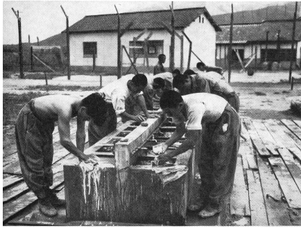
Grosse Wäsche in einem Lager für kriegsgefangene Nordkoreaner in Pusan.