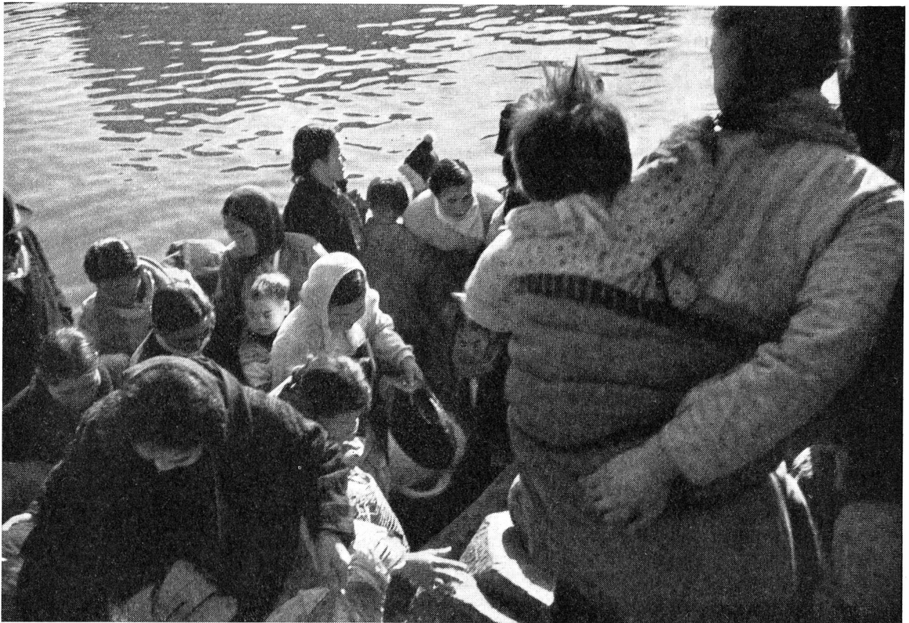
Die Frauen und Kinder eines südkoreanischen Dorfes haben wieder einmal ihr von den Kriegshandlungen bedrohtes Dorf verlassen und nach Süden fliehen müssen. Möge es für sie das letzte Mal gewesen sein! Nun ist ja inzwischen der Waffenstillstand abgeschlossen worden. Wieviele werden wohl noch in das zerstörte Dorf heimkehren können? Die Verluste unter der koreanischen Zivilbevölkerung sind ausserordentlich gross.

besitzen sie als Zufluchtsorte die grössten Aussichten, von Freund und Feind respektiert zu werden und der in der 4. Genfer Konvention festgelegten Kategorie der Zivilbevölkerung die härtesten Leiden zu ersparen. Weshalb könnten diese Zonen nicht wenigstens vorbereitet werden?