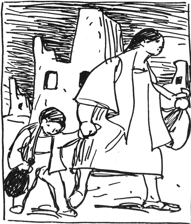
Zeichnungen von Kobi Baumgartner

Frauen, Kinder und Greise, ja selbst das Vieh wurden durch Maschinengewehrfeuer niedergemäht oder lebendig verbrannt, sämtliche Häuser des Dorfes zerstört.