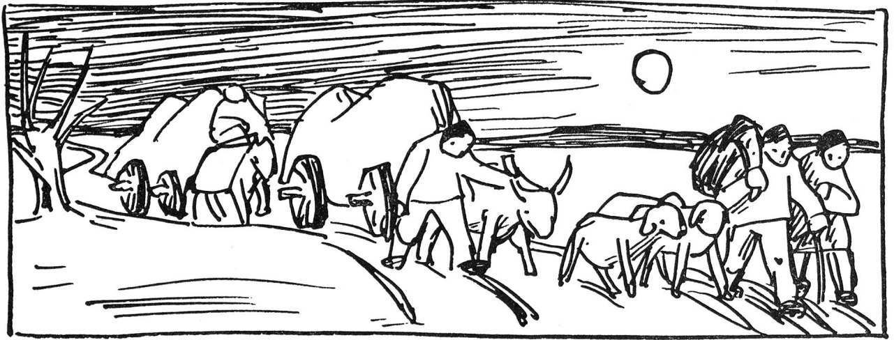
Zeichnung von Kobi Baumgartner

tal ermöglicht werden kann. Wie froh würden alle die Helfenden nach einem Bombenangriff sein, wenigstens einen Teil der Bevölkerung in einem verhältnismässig geschützten Gebiet zu wissen und sich nicht auch noch um sie kümmern zu müssen!