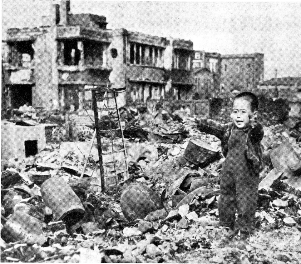
Ein trostloses Bild aus der südkoreanischen Hauptstadt Söul: ein verlassenes Kind weint, mitten in den Ruinen seiner Vaterstadt, nach der Mutter. Ist sie tot? Ist sie krank oder verwundet? Wir wissen es nicht. Uns bedrückt dieses erbarmungslose Verlassensein eines so jungen Kindes, das, nun den Geschehnissen hilflos ausgeliefert, Anrecht auf Schutz und warme Fürsorge hätte.

den Gemeinden, von den Kantonen und vom Bund. Dann aber auch von der Bevölkerung selbst. Wie oft habe ich es erleben müssen, dass in Stunden grösster Gefahr jeder alles Gut hergegeben hätte, um nur das nackte Leben zu retten! Doch, dann war es zu spät.