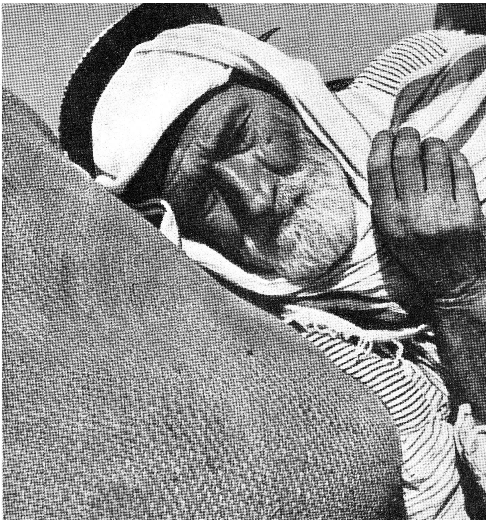
Arabischer Flüchtling.

Die Kommission der Vereinigten Nationen für die Flüchtlinge Palästinas (UNRWA) hat in den Flüchtlingsgebieten 79 Kliniken eröffnet und verfügt heute über ungefähr 2000 Spitalbetten. Die Ausbildung von eingeborenen Arztgehilfen wird fortgesetzt.