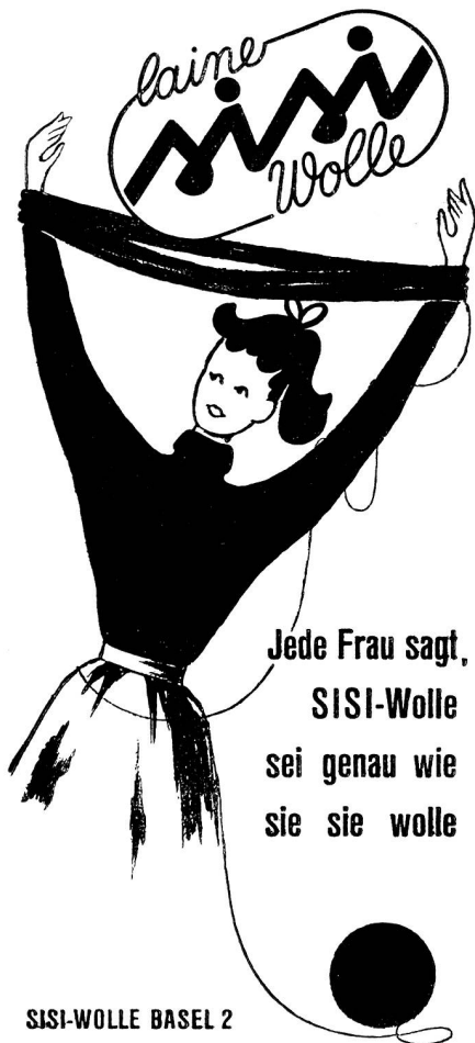
SISI-WOLLE BASEL 2

Stepdecken Flaum-Wollfüllung Bettüberwürfe in gesteppter Ausführung Couchdecken Asco Hygiene-Daunendecken mit abnehmbarem Anzug (waschbar) Flaumbettwaren Asco-Schlafsäcke Dekorationsstoffe