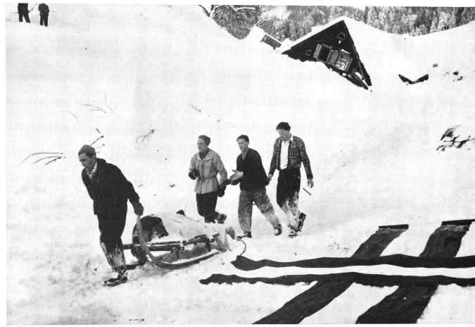
Das Dorf Blons im grossen Walsertal ist am 11. Januar von einer Katastrophe grössten Ausmasses heimgesucht worden. Während des Tages stürzten von den Hängen der Alp Hüggla drei Lawinen ins Dorf und zerstörten mehr als die Hälfte der Wohnhäuser. Während die Leichen der Verunglückten unter dem Schnee zwischen entwurzelten Bäumen, Hausruinen und totem Vieh lagen, wurden die zahlreichen Verletzten verhältnismässig rasch mit Helikoptern nach Bludenz in Pflege transportiert. Unser Bild zeigt eine Rettungsmannschaft, die einen Schwerverletzten aus dem rechts oben sichtbaren umgestürzten Haus, am für die Helikopter ausgelegten Tuchkreuz vorbei, in Sicherheit bringt.