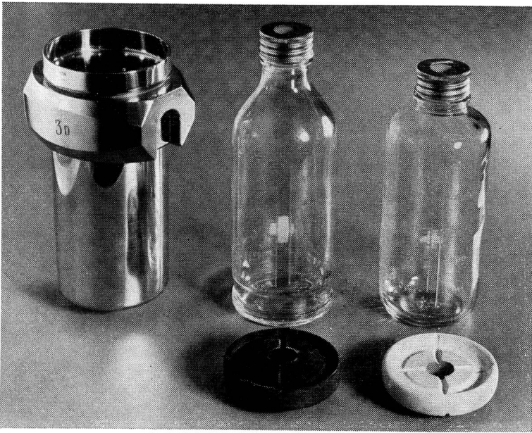
Abb. 1. Der zur Zentrifuge gehörende Gehängebecher mit Blut- und Plasmaflasche.