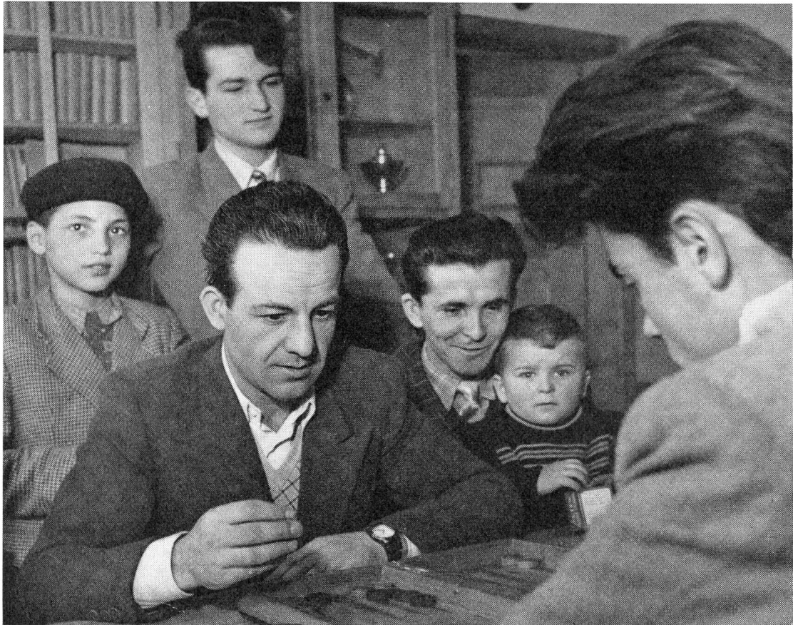
Während die Frauen beim Tischdecken, Abräumen und Geschirrspülen helfen oder handarbeiten, unterhalten sich die jungen Männer und Knaben mit allerlei Spielen.