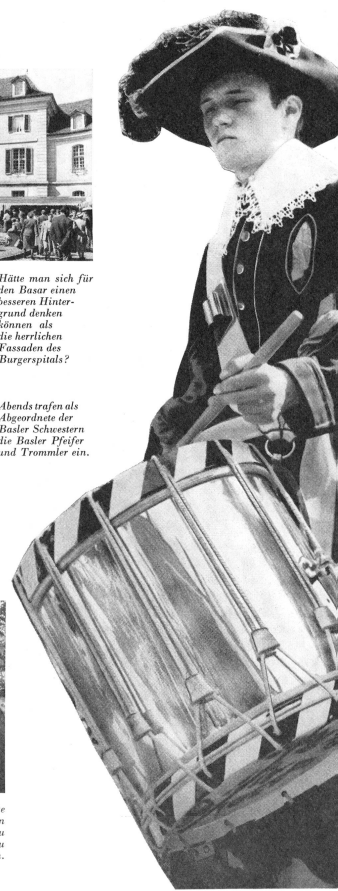
Abends trafen als Abgeordnete der Basler Schwestern die Basler Pfeifer und Trommler ein.