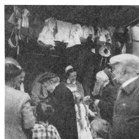
Die reiche und unerwartete Hilfsbereitschaft all jener, die sich als Freunde des Lindenhofs bekannten, haben nicht nur die Stände gefüllt, sondern diese Freunde haben sich auch selbst für die mannigfaltigsten Aufgaben und Verrichtungen die ein Basar mit sich bringt, zur Verfügung gestellt.