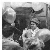
Die Kinderballons verliehen dem Basar ein besonders buntes und heiteres Aussehen.