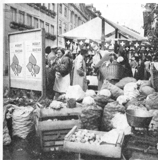
Auch der Lindenhof-Märit an der Herrengasse wurde stark besucht.

Jardin da Luxembourg in Paris? Nein! Nächliche Feststimmung am Lindenhof Basar in den Höfen und Gärten des Burgerspitals Bern. Dessen Platzverhältnisse und Möglichkeiten zeigten sich anlässlich des Basars in einem ganz neuen Lichte.