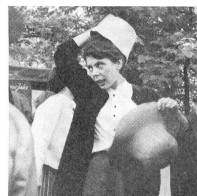
Jeder Hut einen Franken! Die Hüte wurden eifrig probiert und hatten einen glänzenden Absatz. Manch eine Frau wird nun trotz Aderungsknoten zu einem billigen Winterhut kommen.