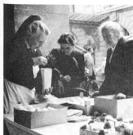
Eine Schwester verkaufte frische Eier. Sie machte beim Füllen der Düten ganz spitze Finger aus lauter Pöckel, die heiklen Schalen einzudrücken. Manch eine Schwester hat am Märittag ungewohnte Arbeit mit Humor und Geschick geleistet.