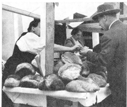
Herlich duftendes, krusperiges Bauernbrot wurde von Kennern mit Begeisterung gekauft und als besondere Gabe heimgebracht.