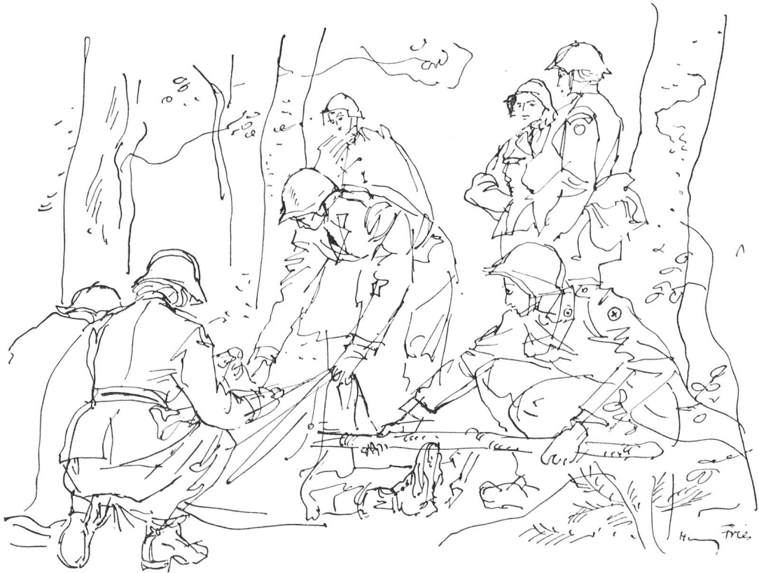
Verwundetentransport mittels eines starken Astes und einer Zelteinheit. Zeichnung von Hanny Fries, Zürich.

Nur kurze Zeit blieb, in die Kaserne zurückgekehrt, zum Retablieren. Denn um 15 Uhr begann die Feier zur Einsetzung in die neue Funktion im Rittersaal des Schlosses Valangin. Im Bewusstsein um die Bedeutung ihrer neuen Verantwortung trat eine jede vor den Rotkreuzchefarzt. Mit einem Handschlag bekräftigten Samariterinnen und Pfadfinderinnen vor dem weissen und roten Kreuz ihre Bereitschaft, sich im Notfalle dem Roten Kreuz und damit der leidenden Menschheit zur Verfügung zu stellen. Stolz nahm jede ihre Jacke mit dem schmalen grauen Streifen entgegen, diesem verpflichtenden Symbol des Vorgesetzten-Seins. Als Gruppenführerinnen verliessen sie Schloss Valangin.