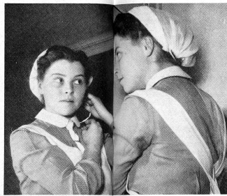
Sitzt das Häubchen auch richtig?