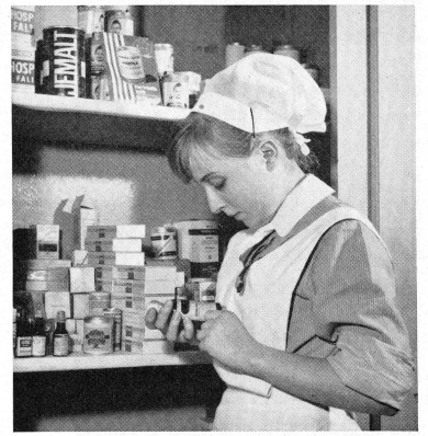
Sie lernen die Medikamente kennen