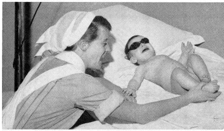
Unter der künstlichen Sonne