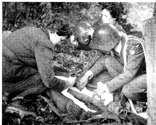
Sanitätsübung im Gelände und Brevetierung im Schloß Colombier.

Die Source war schon von allem Anfang an mit den Bestrebungen des Roten Kreuzes eng verbunden. Von Castiglione aus, wenige Tage nach der Schlacht von Solferino, wandte sich Henri Dunant in erster Linie an die Gräfin de Gasparin um Hilfe. Während des Deutsch-französischen Krieges pflegten die Schülerinnen der Source die französischen Internierten in der Schweiz unter der Hut des Roten Kreuzes. 1903 wurde die Source Korporationsmitglied des Schweizerischen Zentralvereins vom Roten Kreuz; die Sourceschwestern stellten sich ihm für den Kriegsfall zur Verfügung. 1913 anerkannte der Bundesrat die Source als Hilfsorganisation des Schweizerischen Roten Kreuzes; die Source verpflichtete sich, der nationalen Rotkreuzgesellschaft im Kriegsfall sämtliches Personal und Material zur Verfügung zu stellen. 1914–1918 arbeiteten Sourceschwestern in 79 Ambulanzen und Militärspitälern des In- und Auslandes. Während des Zweiten Weltkrieges leisteten 600 Sourceschwestern zusammen über 70000 Aktivdiensttage in der Schweizer Armee, vor allem in den MSA 1, 2 und 4, in den chirurgischen Ambulanzen IV/1 und III/10 und in den Territorial-Spitaldetachementen. Heute sind 244 Sourceschwestern (plus 122 Reserve) in den Formationen des Schweizerischen Roten Kreuzes eingeteilt; davon haben 35 einen Kadernkurs mit Erfolg bestanden und sind Detachementsführerinnen, Oberschwwestern und Dienstführerinnen.