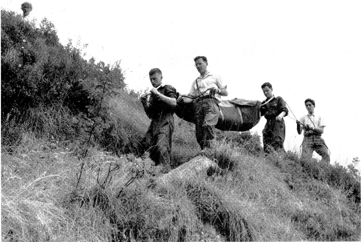
Das vielbeachtete Transportgerät der Juniors des Französischen Roten Kreuzes wurde von den Juniors der verschiedenen Länder ausprobiert, photographiert und die einzelnen Bestandteile skizziert.