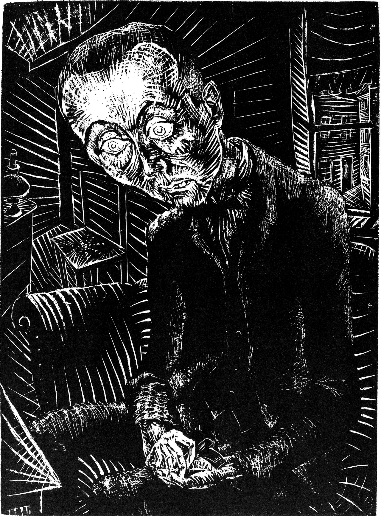
Altersdepression. Holzschnitt von Ignaz Epper, Ascona.