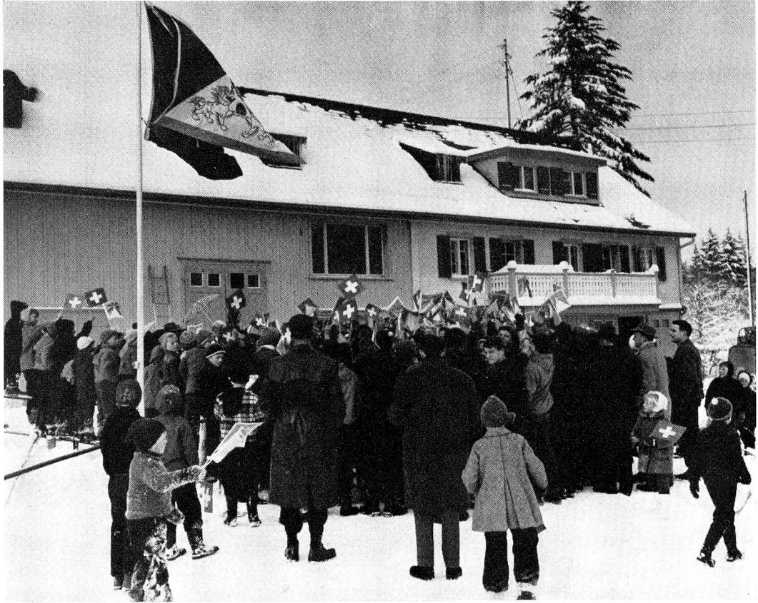
Ganz Waldstatt hat die Tibeter mit offenen Armen empfangen und ihnen eine schöne tibetische Fahne geschenkt, die nun während des Empfanges aufgezogen, vereint mit der Fahne unseres Landes im Winde flattert. Im Hintergrund das Tibeterhaus. Nicht nur die Behörden von Waldstatt hiessen die Tibeter – sie mit einem reichen Vesper – willkommen, sondern auch die Schulkinder erfreuten die neuen «Bürger» von Waldstatt mit Talerrollen, Jodeln und Reigen. Abends spendeten die Samariterinnen ein heiss ins Tibeterhaus gebrachtes Nachtessen