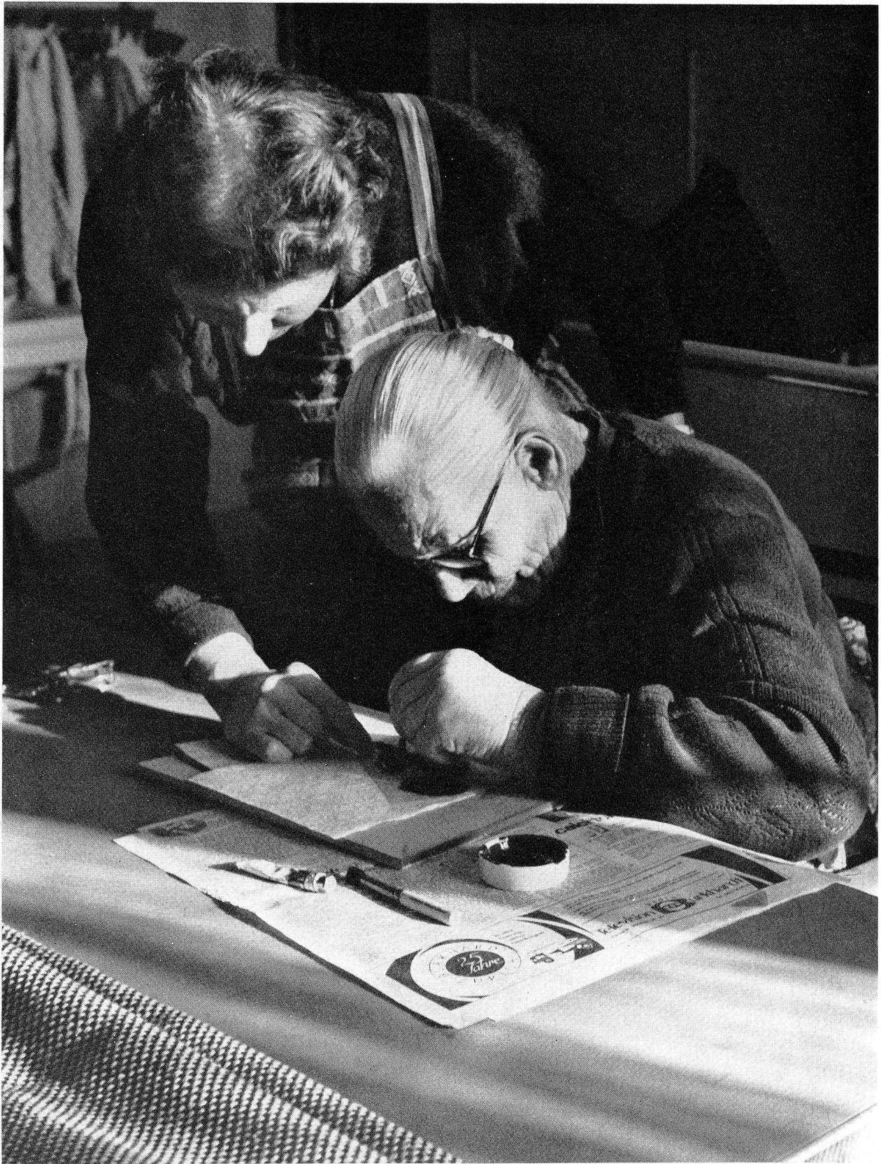
Eine Betagte stempelt mit allerlei Farben hübsche Ornamente auf Papierservietten: Geburtstagsgeschenk an eine liebe Verwandte. Eine Zürcher Rotkreuzbastlerin hat sie diese Kunst gelehrt, die ihr nun manch eine beglückende Stunde in ihren sonst eintönigen Alltag bringt.