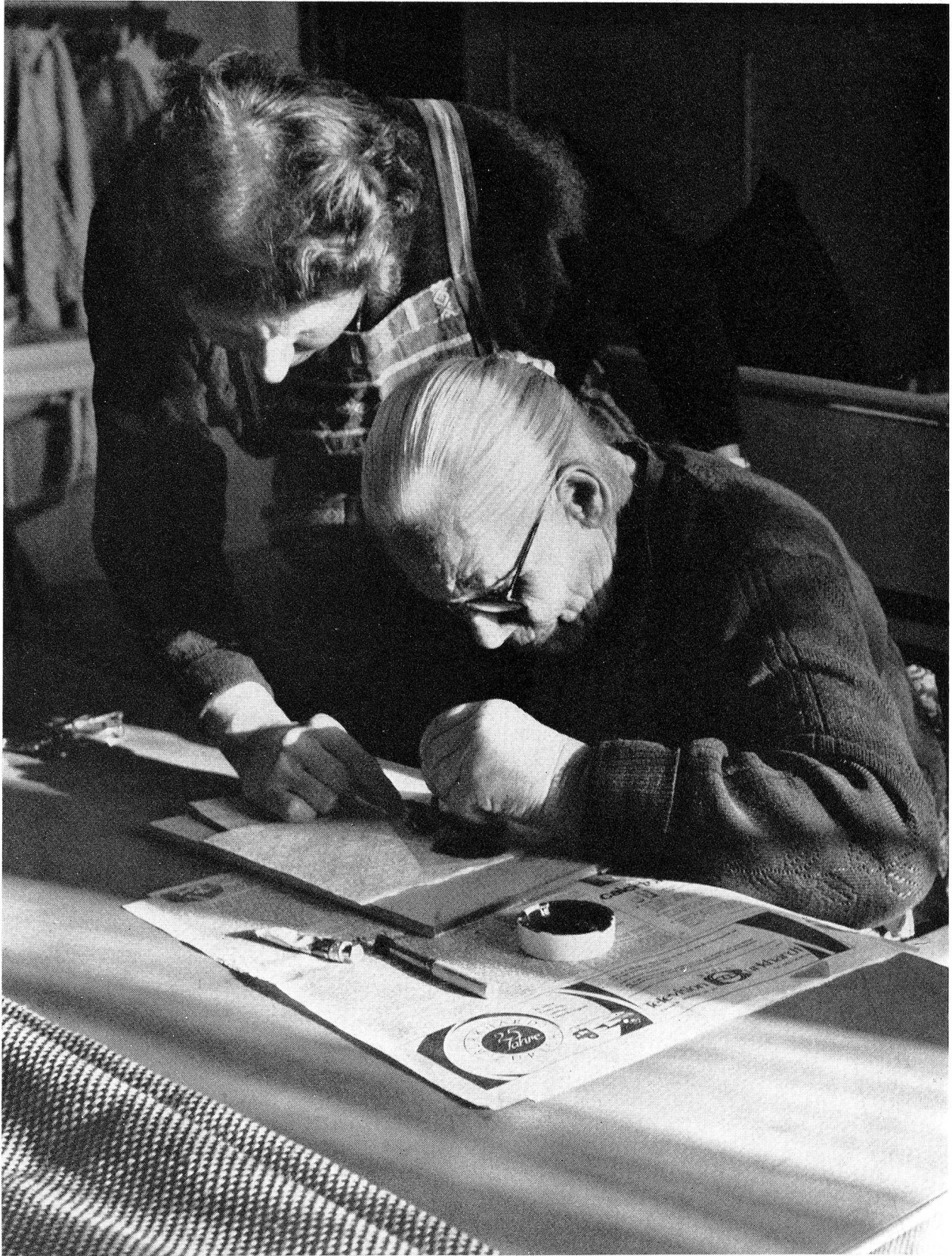
Eine Betagte stempelt mit allerlei Farben hübsche Ornamente auf Papierservietten: Geburtstagsgeschenk an eine liebe Verwandte. Eine Zürcher Rotkreuzbastlerin hat sie diese Kunst gelehrt, die ihr nun manch eine beglückende Stunde in ihren sonst eintönigen Alltag bringt.