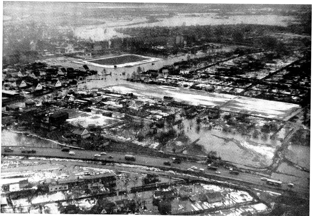
Der Hamburger Stadtteil Wilhelmsburg am 22. Februar 1962, ein Teil des von der Überschwemmung am meisten heimgesuchten Gebietes in Hamburg.