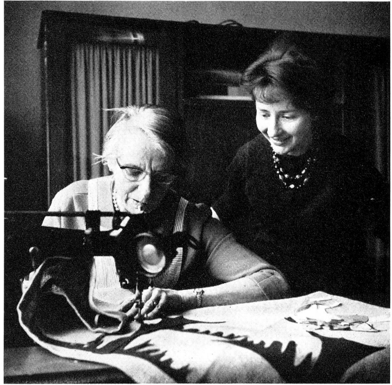
Bild unten: Anlässlich eines Bastelkurses in der Sektion Zürich des Schweizerischen Roten Kreuzes entstanden allerlei Köstlichkeiten. Was diese Frauen hier gelernt haben, werden sie als Rotkreuzbastlerinnen zu den Betagten, Gebrechlichen oder Chronischkranken bringen.

Bild rechts: Eine einseitiggelähmte ehemalige Schneiderin näht mit Hilfe einer Rotkreuzbastlerin einen lustigen «Märchenwandbehang». Diese Arbeit, die sie sich bis vor kurzem nicht mehr zugetraut hätte, stärkt ihren Lebenswillen und bringt richtige Schöpferfreude in ihren Alltag.