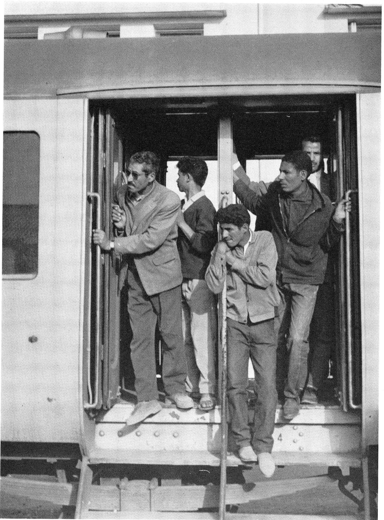
Der erste Zugtransport von Oujda (Marokko) nach Tlemcen (Algerien) fand am 10. Mai 1962 statt. Dieser Zug brachte 193 allein-stehende algerische Flüchtlinge, alles Männer, in ihre Heimat. Sie verabschiedeten sich mit ernsten Gesichtern von ihren Kameraden, die noch für einige Tage, vielleicht noch für einige Wochen in Oujda zurückblieben, bis die Reihe an ihnen war, in ihr Land zurückzukehren. Keiner kennt die Zukunft. Für manch einen Heimkehrten wird sie hart sein.