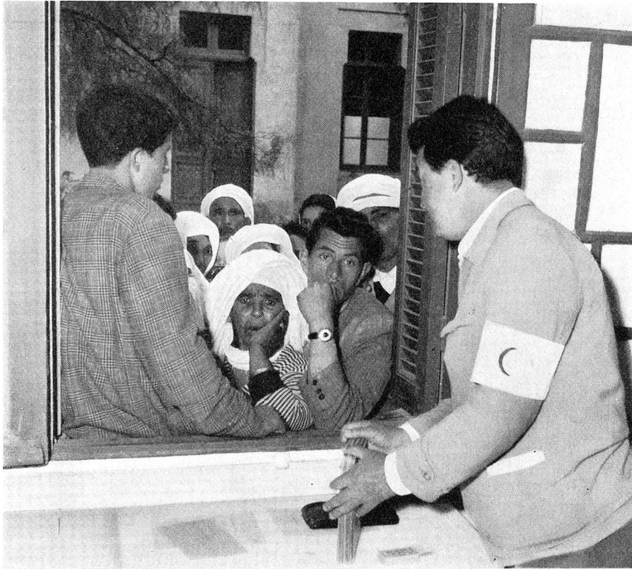
Vor der Abreise der algerischen Flüchtlinge in Oujda (Marokko) werden die Ausweispapiere, die alle von den Delegierten der Liga der Rotkreuzgesellschaften in mühevoller Kleinarbeit ausgestellt und mit einer Foto des Inhabers versehen worden sind, noch einmal überprüft und die Foto mit dem Besitzer der Papiere verglichen.