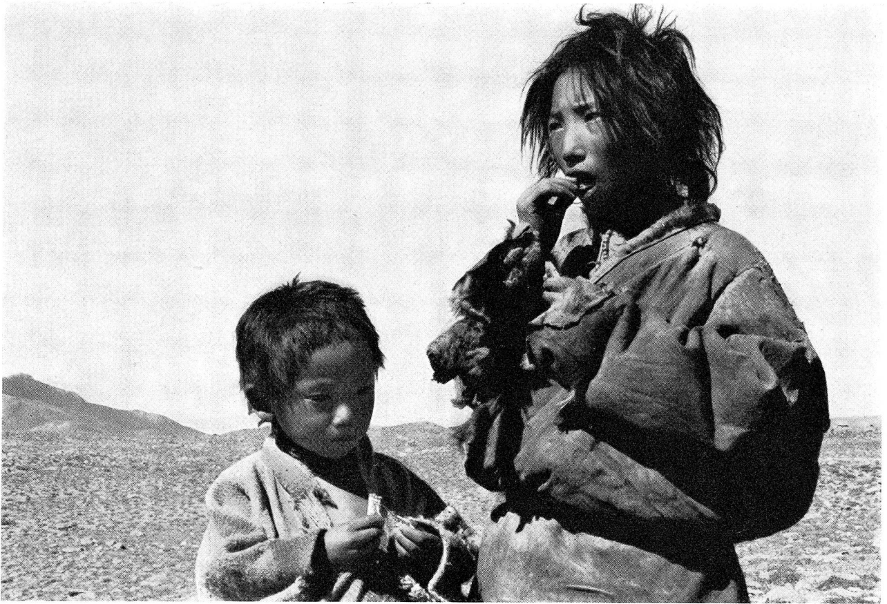
In Nepal sind noch lange nicht alle tibetischen Flüchtlinge von der Rotkreuzhilfe erfasst. Überall tauchen kleine Gruppen auf, die Not leiden. Trostlosigkeit in einem Kindergesicht bedeutet einen schweren Vorwurf an die Welt.