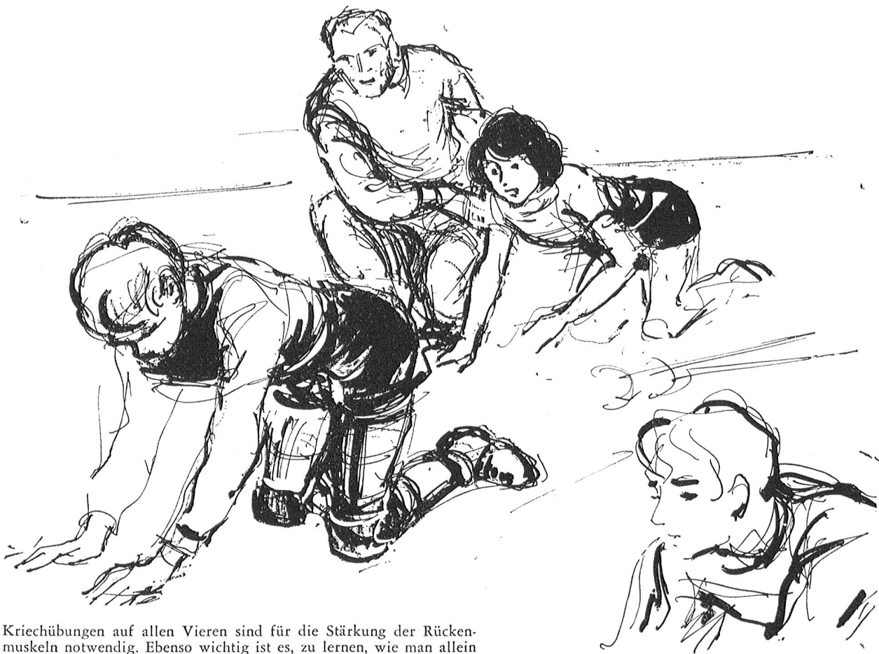
Kriechübungen auf allen Vieren sind für die Stärkung der Rückenmuskeln notwendig. Ebenso wichtig ist es, zu lernen, wie man allein aufstehen kann, wenn man fällt und keine Hilfe in der Nähe ist.

Ein fünfunddreissigjähriger Mann, der sein eines Bein im Oberschenkel amputiert hat und das andere nur noch mit Mühe bewegen kann, erzählt uns: «Als ich noch im Besitze meiner beiden gesunden Beine war, habe ich das als Selbstverständlichkeit empfunden und mich, offen gesagt, nie um einen Invaliden gekümmert. Ich konnte Fussball und Handball spielen, wandern und schwimmen. Mehr als ein halbes Jahr lag ich im Spital, mit meinem Schicksal konnte ich mich anfangs kaum abfinden. Während vieler Wochen betrieb man Heilgymnastik mit mir, aber eines Tages war das zu Ende; denn unbeschränkt dauern diese Nachbehandlungen nicht. Es war für mich un-