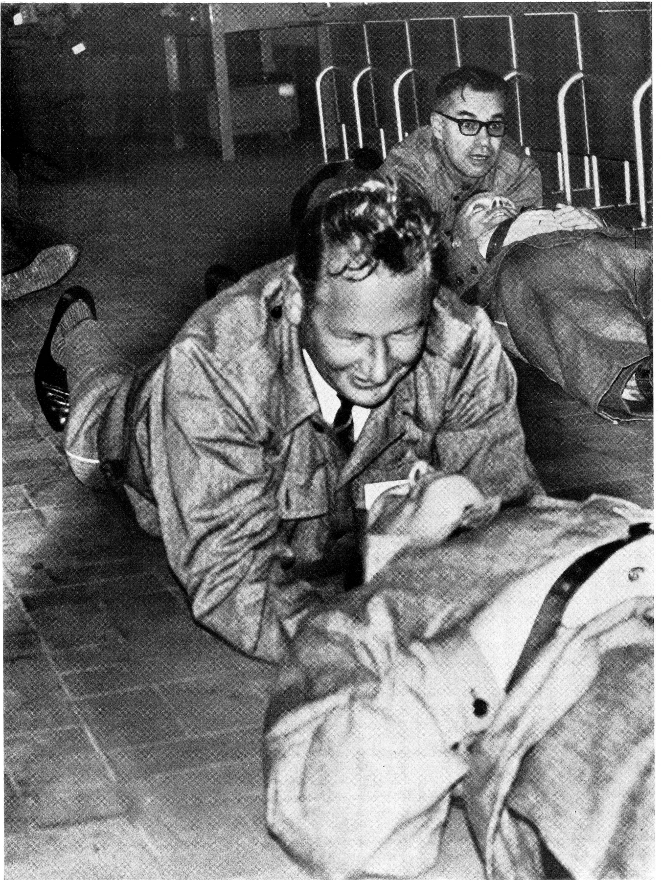
Der Nackenschleifgriff wird geübt. Er ist keineswegs so einfach, wie es auf unserem Bild den Anschein hat, und doch sind diese Kunstgriffe von äusserster Wichtigkeit; denn wie oft muss man im Ernstfall einen Verletzten aus einer Gefahrenzone heraus- holen, ohne dass Bahren oder andere Hilfsmittel zur Verfügung stehen.