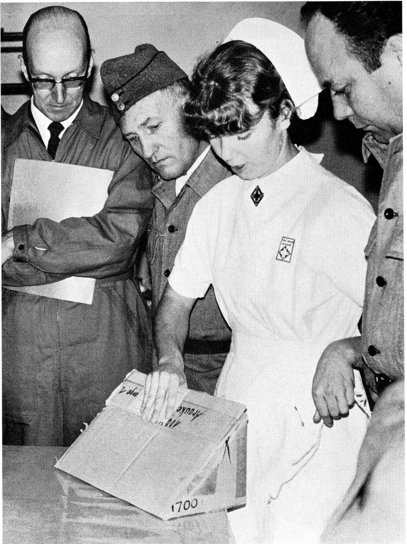
Im Spätherbst des vergangenen Jahres führte das Bundesamt für Zivilschutz erstmals nach der neuen gesetzlichen Ordnung vier Kurse für Kantonsinstruktoren des Sanitätsdienstes im Zivilschutz durch. Die Teilnehmer – insgesamt waren es 88 Frauen und Männer – sollten als Laienhelfer in einem sechstägigen Kurs für ihre zukünftige Aufgabe vorbereitet werden, um in den Kantonen die Ausbildung der Sanitätsmannschaften nach einheitlichen Gesichtspunkten sicherzustellen (Ausbildung von Regional- und Hilfsinstruktoren). Auf unserem Bild zeigt ihnen eine Krankenschwester des Schweizerischen Roten Kreuzes, wie man mit einfachen Mitteln eine bequeme Rückenstütze für Kranke herstellen kann.