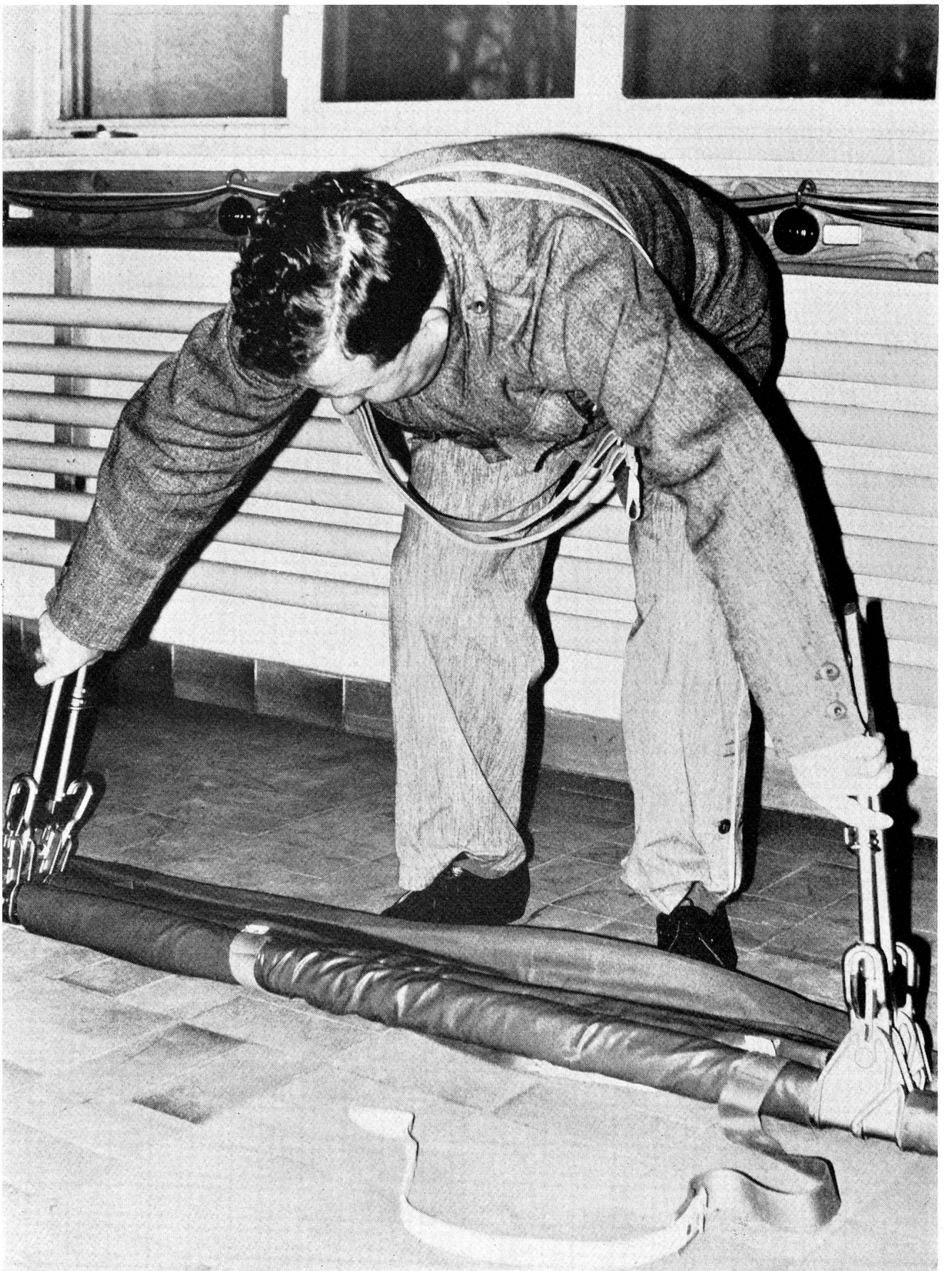
Unser Bild zeigt einen künftigen Instruktor des Sanitätsdienstes im Zivilschutz bei der praktischen Arbeit an der neuen Armeebahre, die für alle jene Ortschaften vorgesehen ist, denen Luftschutztruppen zugeteilt werden.