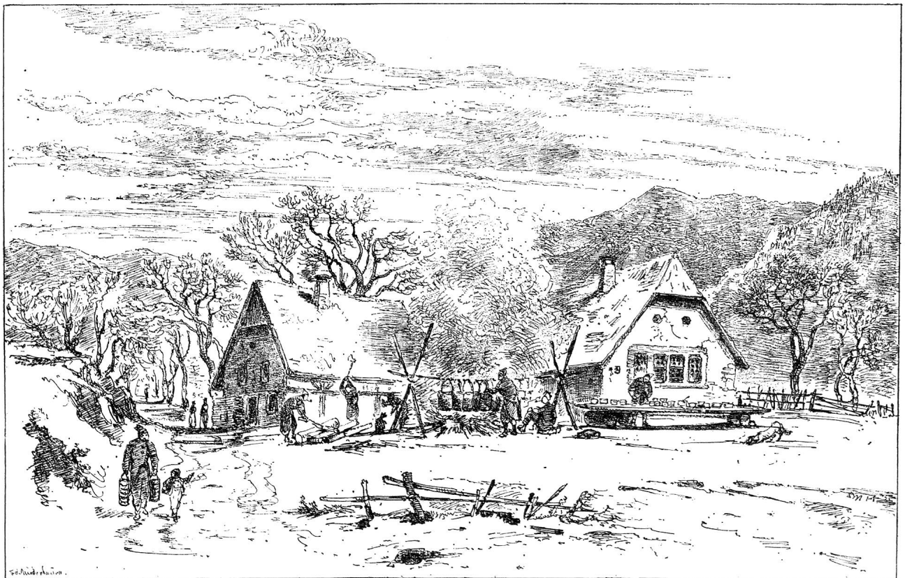
Feldküche der vierten Kompagnie bei Siglistorf

Mit der Bourbaki-Armee waren auch rund 18 000 Kranke in die Schweiz gelangt; schwere Infektions- und Erkältungskrankheiten forderten zahlreiche Opfer. Der Sanitätsdienst wurde durch die kantonalen Militärbehörden organisiert, wobei neben schweizerischen auch französische Aerzte sowie Sanitäter aus der fran-