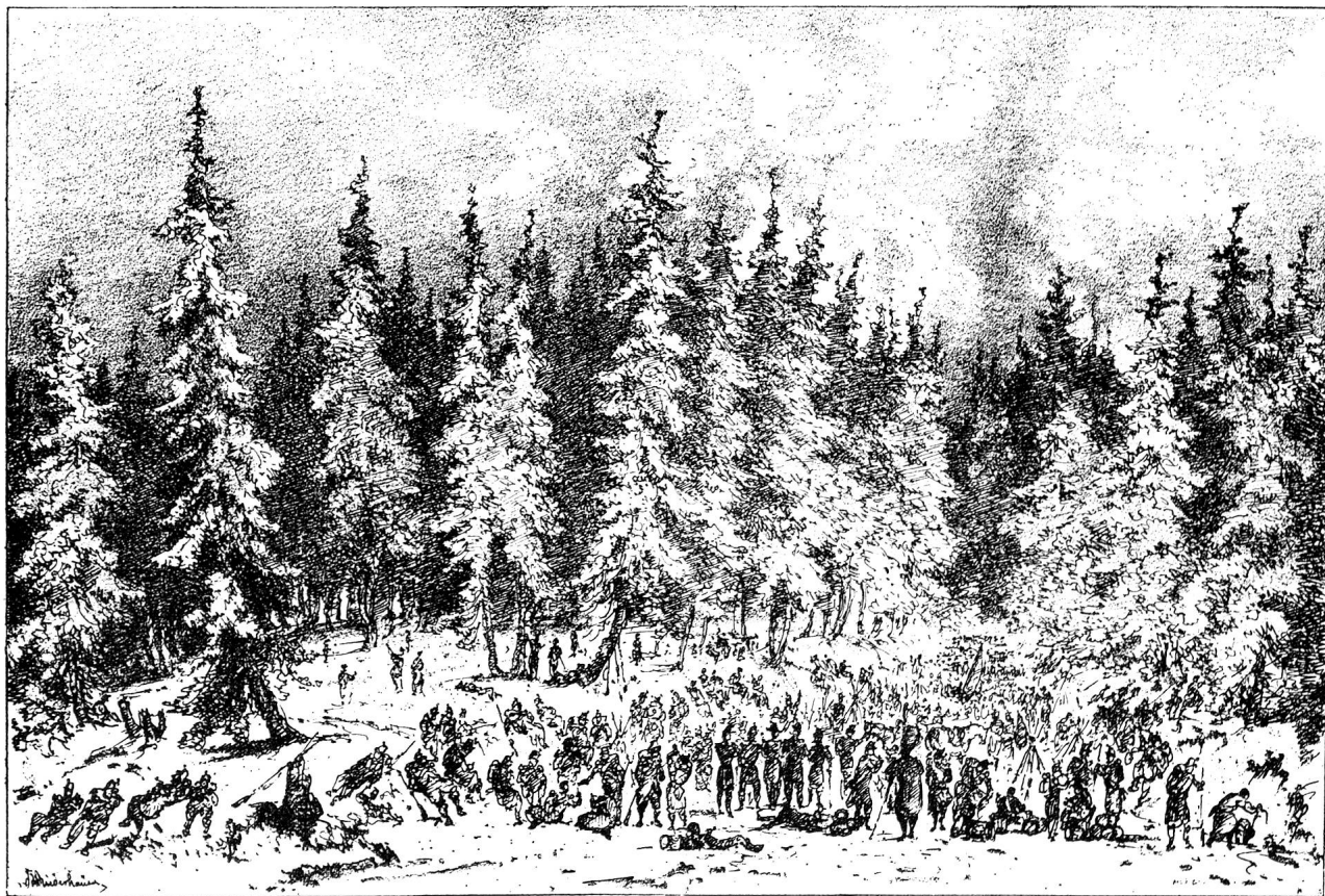
Marschhalt in den Wäldern zwischen Payerne und Yverdon

«Mon opinion n'est pas, vous le savez, qu'il faille en temps de paix des Comités cantonaux, mais que le Comité central s'assure seulement dans chaque Canton un correspondant bien qualifié qui le représente, exécute ses instructions, et, en cas de guerre, prenne l'initiative pour la formation de Comités locaux.»