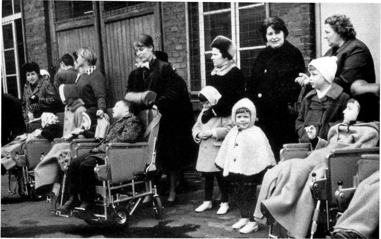
Kinder aus Bonn, die vom Deutschen Roten Kreuz zu einer Probefahrt mit dem Schweizer Freundschaftscar eingeladen wurden, verfolgen gespannt die für sie veranstaltete Uebung der Feuerwehr.