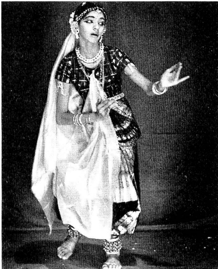
4. Südindische Tänzerin