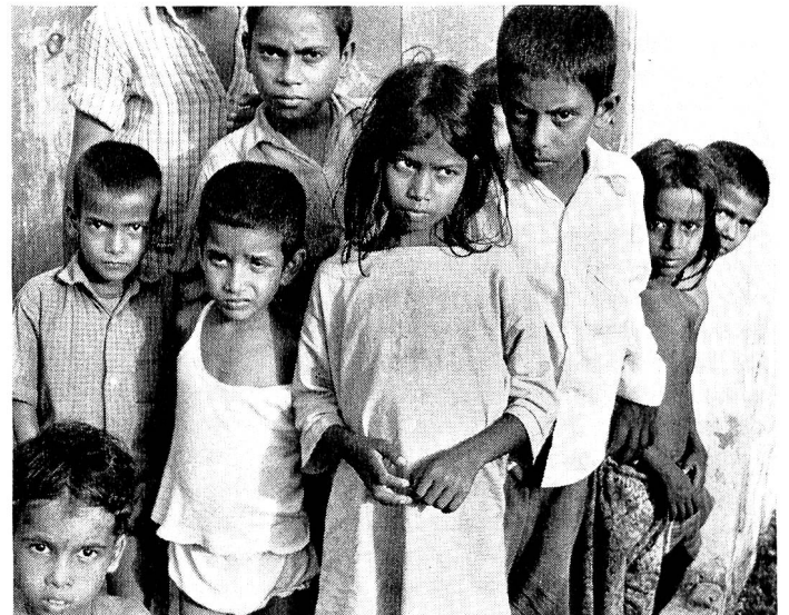
5. In einem Bihari-Lager in Bangladesh