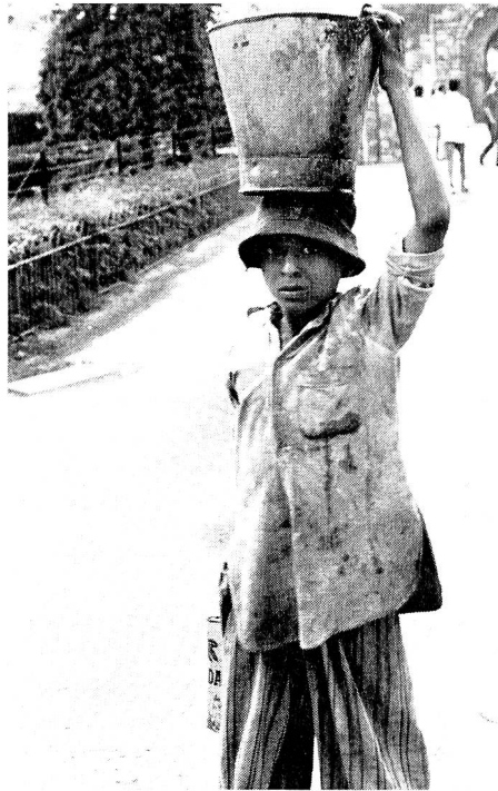
2. Kleiner Wasserträger in Delhi