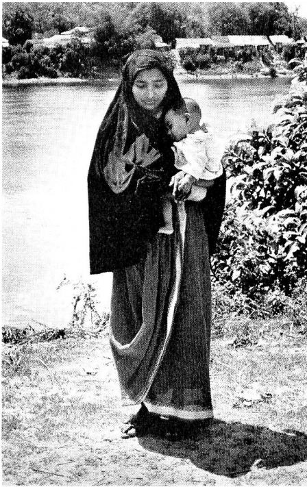
1. Mutter und Kind in Bangladesh