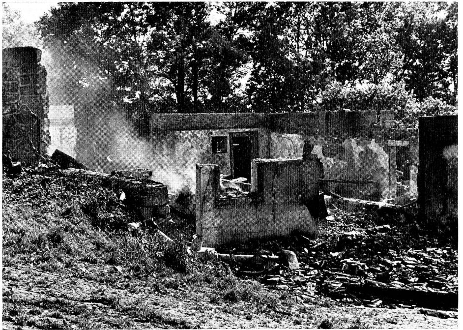
Brandfälle ereignen sich trotz Sicherungsmassnahmen immer noch häufig, und manchmal bleibt von einem Haus, das einer Familie während vieler Jahre Heimat bedeutete, nur noch ein Schutthaufen. Das Rote Kreuz hilft den in Not Geratenen mit Möbeln, Kleidern und Hausrat.

Wir gehen zu der jungen Frau, die dort sitzt, vom Schreck noch ganz benommen. Am Nachmittag des Vortages war es geschehen: Der Blitz hatte eingeschlagen und innert kürzester Zeit das alte Bauernhaus eingeschert, in das sie vor kurzem erst, aus der Stadt kommend, als Mieter eingezogen waren, sie und ihr Mann mit ihrem achtjährigen Kind. Nun standen sie da und hatten nichts mehr, als was sie auf dem Leibe trugen.