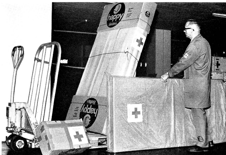
In der Materialzentrale des Schweizerischen Roten Kreuzes wurden letztes Jahr nebst vielem anderem Material 168 voll ausgerüstete Betten zum Versand gebracht.

In der Küche, wo wir mit Sprudelwasser unsere durstigen Kehlen labten, erzählte Herr