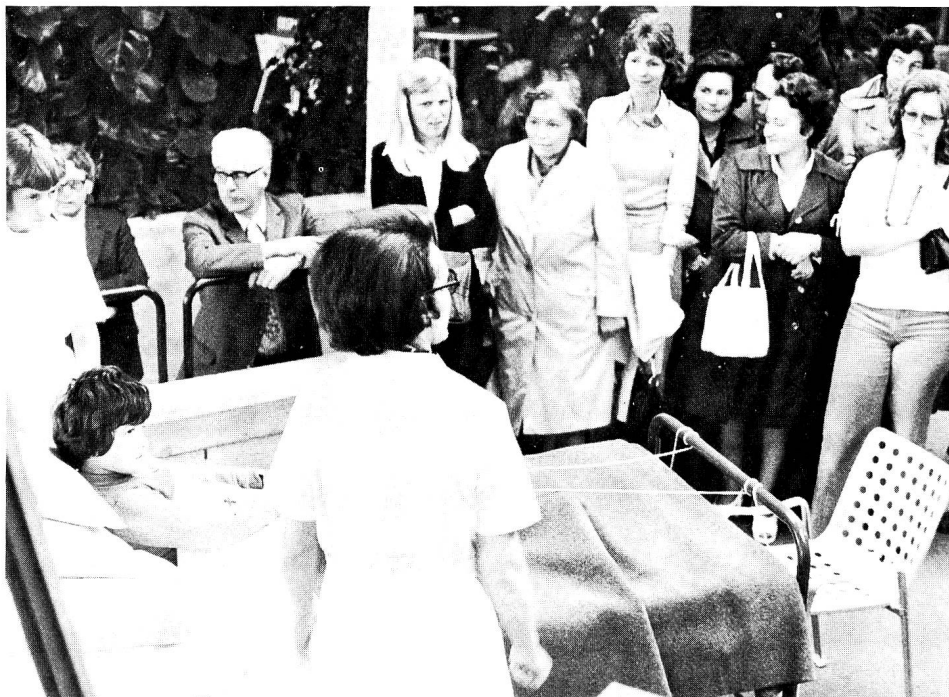
Was tun, wenn in der Familie jemand erkrankt? Dies zeigte die Rotkreuz-Sektion mit Ausschnitten aus dem Kurs für häusliche Krankenpflege an der Ausstellung in Winterthur

Das SRK ist in erster Linie für die Schweizer Bevölkerung da. Es ist Treuhänder ihrer solidarischen Hilfe an Notleidende aller Art. Die Ausstellung zeigt auf grossen Tafeln verschiedene Aspekte der Rotkreuztätigkeit