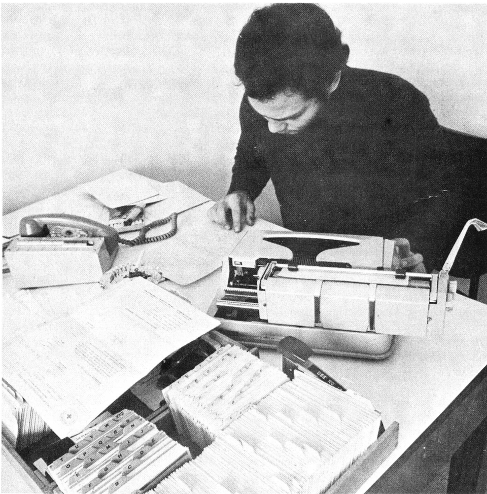
Während des Bürgerkrieges im Libanon erhielt der Suchdienst des Internationalen Komitees vom Roten Kreuz Tausende von Anfragen nach Vermissten und vermittelte Nachrichten an Angehörige, mit denen direkte Kontakte nicht mehr möglich waren.