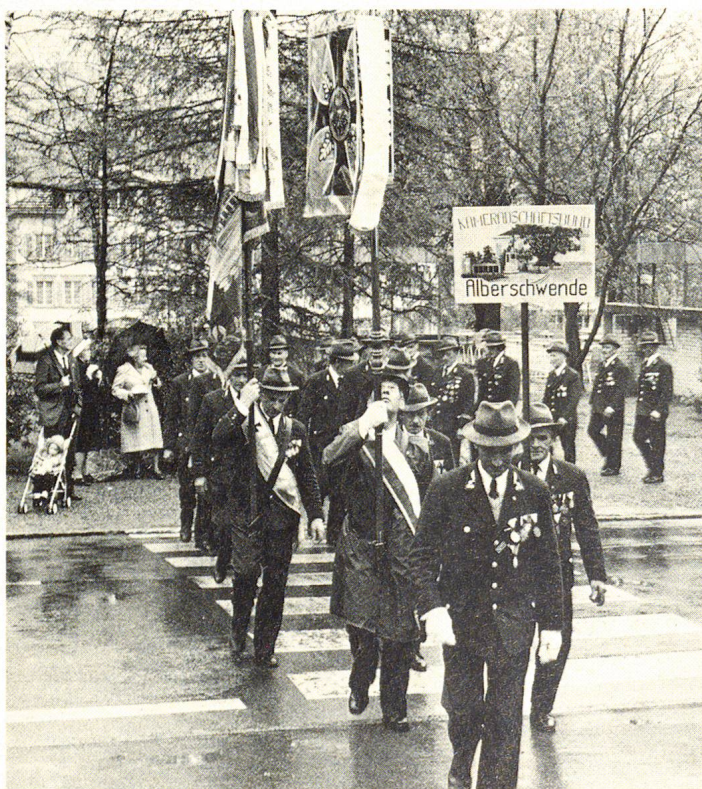
Der Kameradschaftsbund aus Alberschwende in Vorarlberg, eine der Abordnungen aus dem benachbarten Ausland.

Aufenthaltsbewilligung für einen mittellosen «Fremden», – ob das nicht Scherereien geben wird? Wie oft lassen wir ein Gebot der Grossherzigkeit unter finanziellen und formellen Bedenken ersticken!