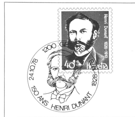
Die neue 40er Marke mit Sonderdatumstempel.

Den Bestellern wird mit dem (den) bestellten Sondercouvert(s) ein Merkblatt zugestellt, das alle nötigen Angaben über den weiteren Ablauf enthält. Daraus nur so viel: Nur adressierte und frankierte Sondercouverts , die bis zum 10. Oktober beim Schweizerischen Roten Kreuz eingetroffen sind, können auf den Sonderflug mitgegeben werden; später eintreffende werden auf dem normalen Postweg (ohne Sonderdatumstempel) an die Adressaten weitergeleitet.