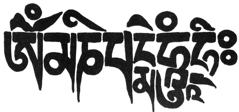
Tibetische Gebetsinschrift: «Om mani padme hum».

Das Klösterliche Tibet-Institut Rikon hat wirklich eine Mission zu erfüllen. Mit den Worten eines Tibeters ausgedrückt: «Das tibetische Flüchtlingsproblem ist nicht nur ein Problem der materiellen Rehabilitation entrechteter, heimatloser Personen; es ist die bewusste Bewahrung und Weitergabe einer uralten Kultur, die den heutigen Menschen im Zeitalter der fortschreitenden Technisierung viel zu bieten hat, und zwar auf den Gebieten der Philosophie, Psychologie und Medizin. Ihr Untergang würde nicht nur für uns Tibeter, sondern für die ganze Menschheit, die wir heute als eine umfassende Kulturgemeinschaft verstehen, einen unersetzbaren Verlust bedeuten. Ausserdem sind wir Tibeter ohne unseren Glauben und unsere Kultur wie Menschen ohne Seele und Identität.»