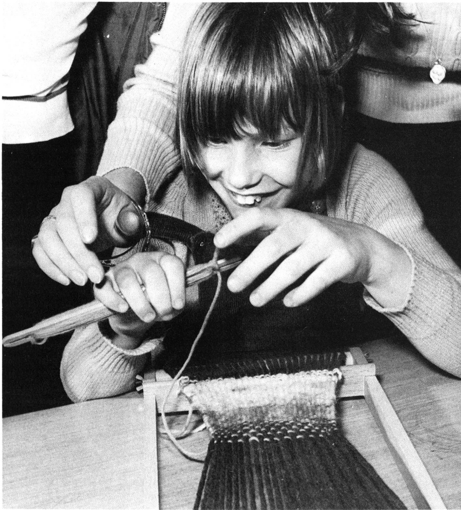
Wir glauben, dass diese Kinder uns leben lehren. Sie haben sicher einen bestimmten Auftrag in dieser Welt. Vielleicht den, uns daran zu erinnern, dass es andere Dinge gibt, als Geld, Ehre, vergängliche Auszeichnungen.

Der Zweck der Werkstättenarbeit besteht darin, den Kindern die Möglichkeit zu geben, sich auszudrücken, produktiv tätig zu sein und sich so zu entwickeln, andererseits, sie an ausdauerndes, sorgfältiges Arbeiten zu gewöhnen. Bei Verkaufsartikeln wird auf gute Qualität von Material und Arbeit geachtet, auch müssen sie zu mindestens 50 % von den Kindern selbst angefertigt werden können (gewisse Arbeitsgänge werden von Erwachsenen ausgeführt). Manche arbeiten vier, andere acht Stunden im Tag; in einzelnen Fällen können später Arbeitsplätze im eigenen Wirtschaftsbetrieb oder ausserhalb des Hauses angetreten werden. Im Herbst 1978 wurde an der Avenue Léman 6 in Vevey eine kleine Verkaufsboutique eröffnet, in der all die Handarbeiten feilgeboten werden. Jeden Nachmittag arbeitet auch eine Gruppe Kinder mit ihrem Lehrer in dem Laden. Das ist eines der Mittel, die Schranken zwischen hüben und drüben allmählich abzubauen. Der Leitung der Cité ist es ein wichtiges Anliegen, den Kontakt mit der Welt der «Normalen» zu fördern und zu verstärken, zum Beispiel