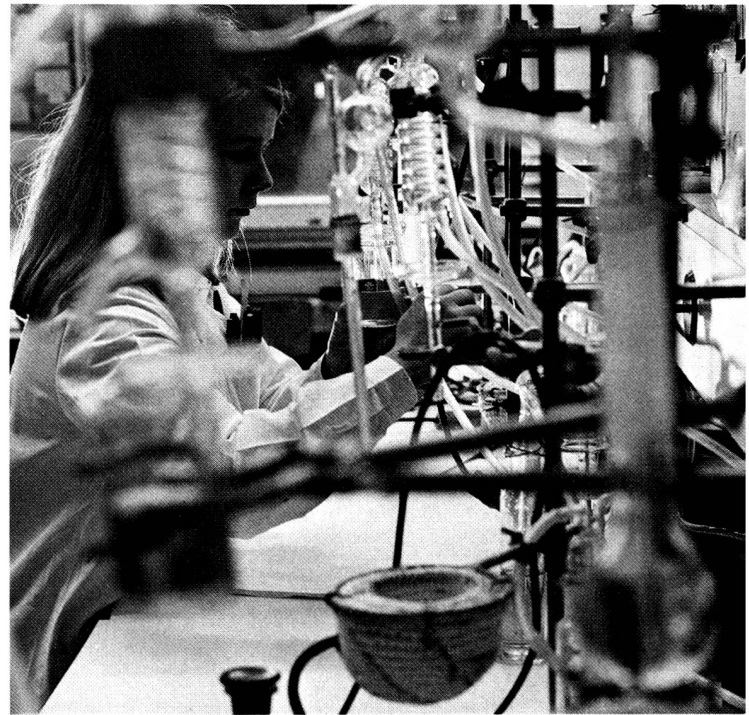
Einige Bilder aus dem Zentrallaboratorium: Automatisierte Blutgruppenbestimmung, Herstellung von Zellpräparaten, Besteckfabrikation, Betriebs-Kontrolllabor, das Zentrallaboratorium in Bern nach der Erweiterung von 1967.