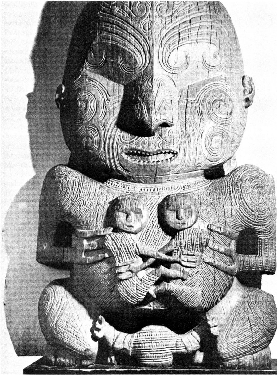
Monumentale Holzskulptur des Maori-Häuptlings Pukaki; Auckland-Museum, Neuseeland. Denken wir im Zusammenhang mit Entwicklungshilfe jeweils daran, dass Zivilisation nicht Kultur bedeutet, dass die Entwicklungsländer Anrecht auf Erhaltung und Pflege ihrer eigenen Kultur haben?

weise über eine oder mehrere Rekrutierungsstellen in Europa verfügen. Auch die Schweiz wäre durchaus in der Lage, für mehrere Länder gleichzeitig die Suche von Personal zu übernehmen, wobei dann der oder die Verantwortlichen der betreffenden Entwicklungsländer die definitive Rekrutierung vornehmen würden. Die normale Vertragsdauer eines Experten beträgt zwei Jahre. Das ist nicht lange genug. Welcher andere Arbeitgeber würde unbesorgt hinnehmen, dass ein neuer Angestellter mit der Idee, nicht länger als zwei Jahre zu bleiben, einsteigt? Und wenn der Arbeitgeber nur allzu gut weiss, dass sein