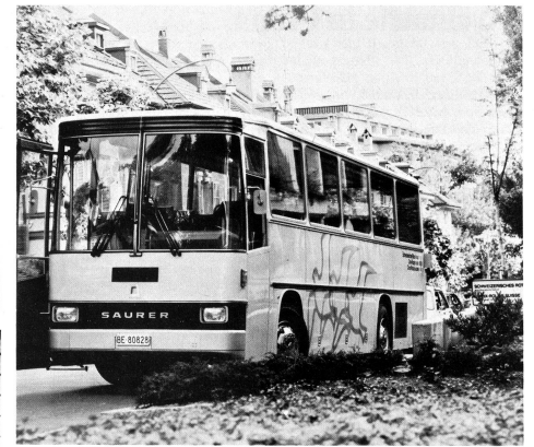
Einweihungsfest für den neuen Invaliden-Car des SRK.