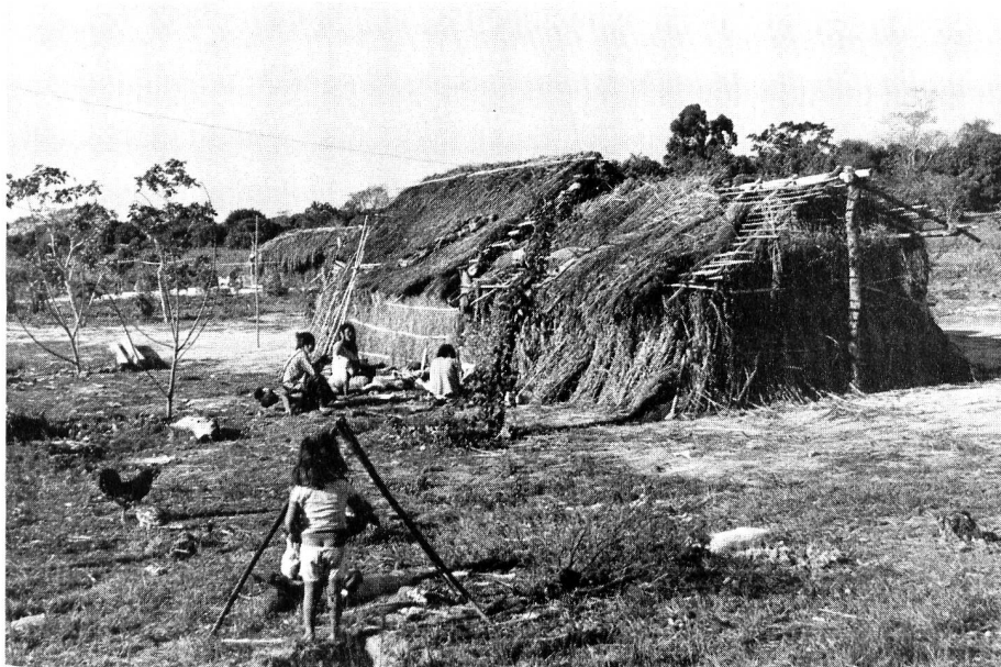
Indianersiedlung in Paraguay.