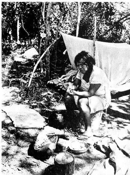
Indianersiedlungen in Bolivien.