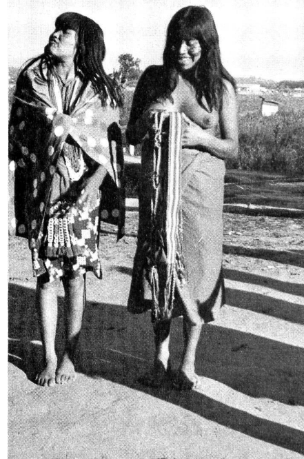
Mädchen aus einem paraguayischen Indianerreservat, das zur Touristenattraktion gemacht wurde!

Das folgende Bild vermag die Berechtigung dieses Postulats vielleicht zu verdeutlichen: Stellen wir uns vor, unsere Gemeinde, Talschaft oder Stadt werde von einer sagen wir paraguayischen Institution zum Standort und Wirkungsgebiet eines Hilfsprojektes erkoren. Wären wir als Bewohner des ausgewählten Ortes einverstanden, wenn ein paraguayischer Ingenieur uns vorrechnen würde, wel-