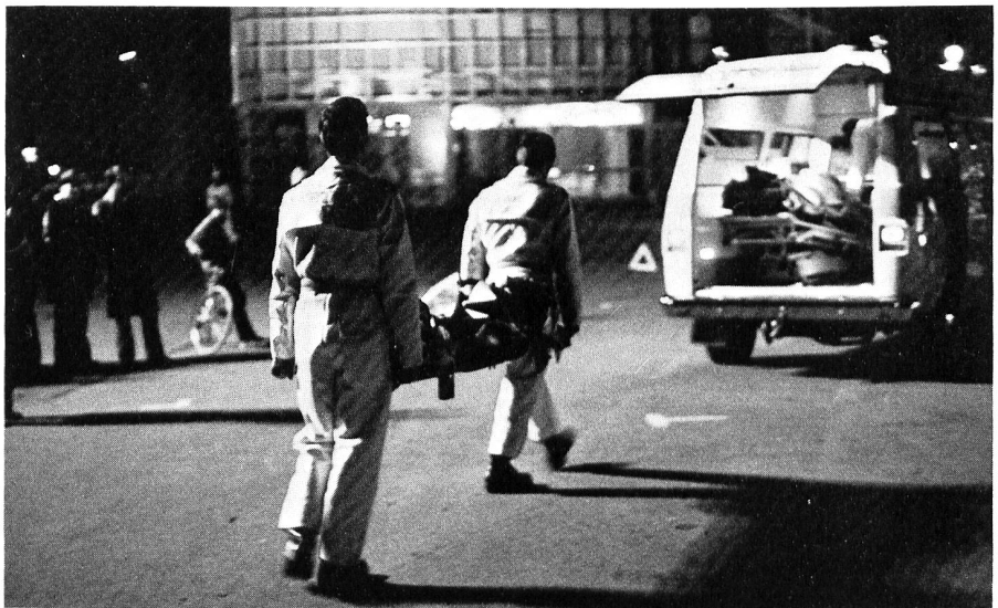
Verstärkte Tätigkeit im Rettungswesen, ja oder nein?

Bei der Frage: Beschränkung auf humanitäre Hilfe oder auch Entwicklungszusammenarbeit? schloss Prof.