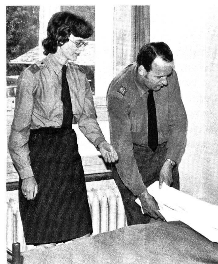
Schon in Friedenszeiten ist die RKD-Schwester unentbehrlich für die Instruktion der Sanitätssoldaten.