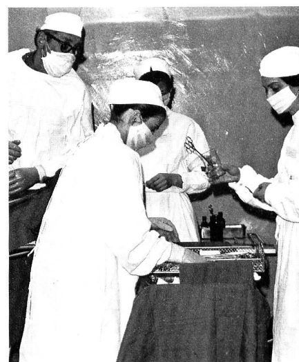
In Übungen und Kursen macht sich die RKD mit der Ausübung der Krankenpflege unter Kriegsbedingungen vertraut.