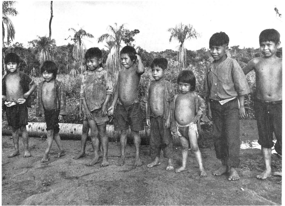
Pai-Tavytera-Kinder sind zur Tuberkulose-Impfung angetreten (Paraguay).