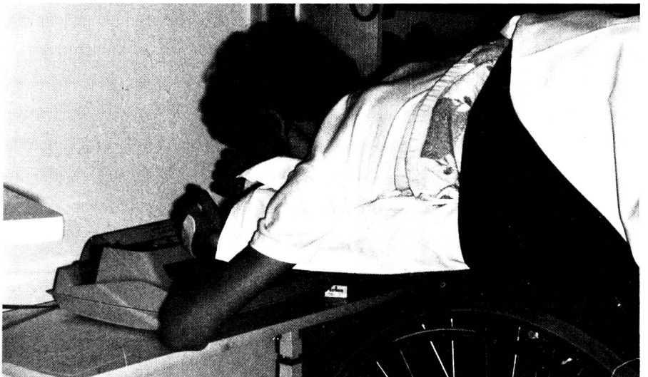
Oben links: Patientin von Beit Chebab, deren Armstumpf mit einem künstlichen Glied ergänzt wurde.