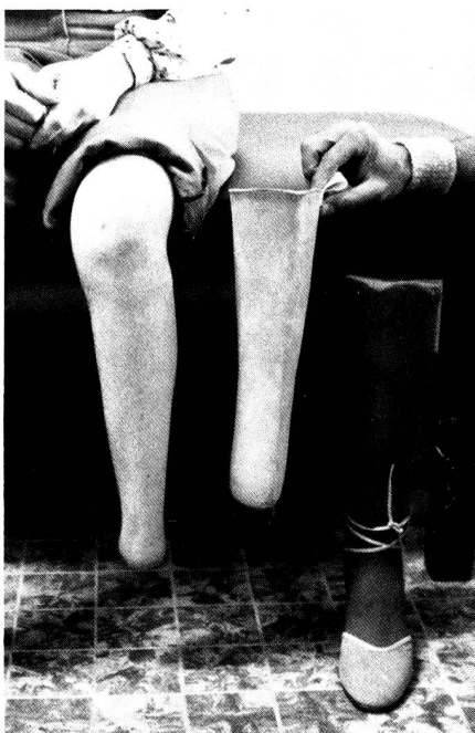
Dank der Prothesen neue Bewegungsfähigkeit für eine junge Libanesin, die beide Füße verlor.

Die Zahl der körperlich Kriegsgeschädigten wird im Libanon auf 8000 Men-