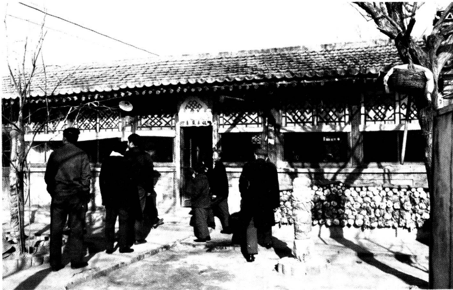
Bauernhaus in der Kommune Zu den vier Jahreszeiten. Jede Familie bekommt Land zugeteilt und baut das Haus mit Hilfe von Nachbarn selber. Im Hof oder auf der Strasse wird oft eigenes Kleinvieh gehalten.