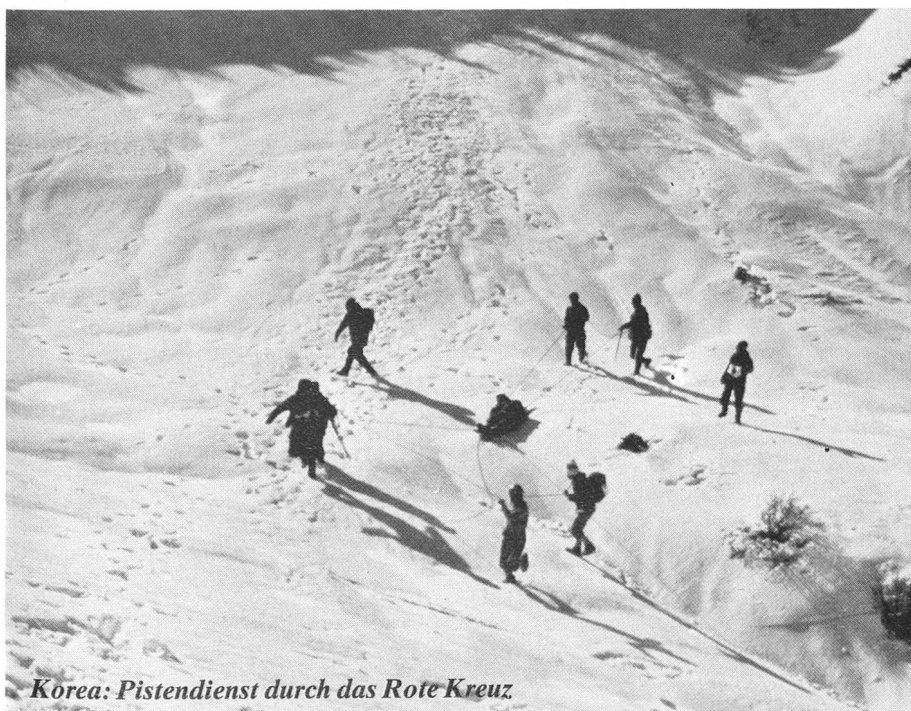
Korea: Pistendienst durch das Rote Kreuz

nen hohen Stellenwert. Es ist deshalb nicht verwunderlich, dass der Weltrotkreuztag 1983 die Bedeutung einer guten Samariterausbildung betont.