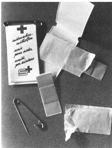
Das Abzeichen: eine Miniapotheke

Alle diese Tätigkeiten brauchen Geld, selbst wenn viele Helfer sich unentgeltlich zur Verfügung stellen.