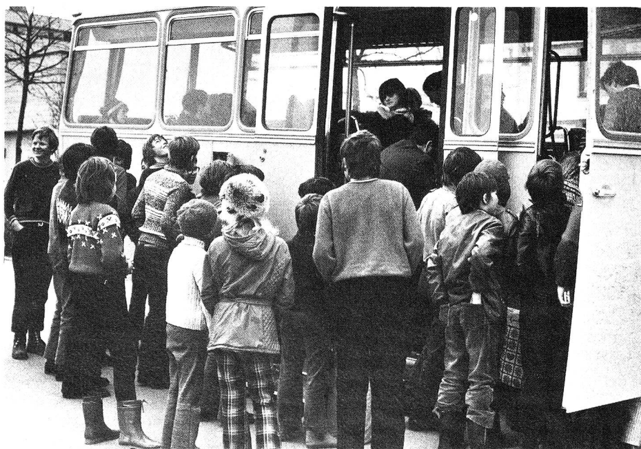
Der «Freundschaftscar» des SRK mit jungen Behinderten unterwegs.

Nach dem Krieg, als die Hilfe erweitert werden konnte, wurde es nötig, eine neue Form dieser Mittelbeschaffung zu finden, um den riesigen Bedürfnissen besser entsprechen zu können. Anstelle der individuellen Patenschaft trat die Kollektiv- oder symboli-