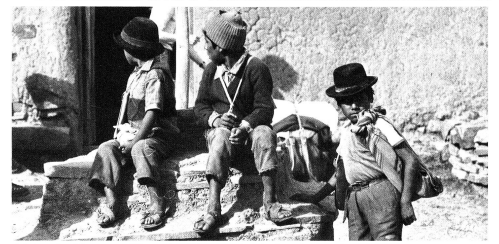
Links: Im Zentrum Thuy An (Vietnam) erhalten körperlich behinderte Kinder Schulung und eine handwerkliche Ausbildung. Das Heim wird zurzeit in Zusammenarbeit mit dem zuständigen Ministerium erweitert.