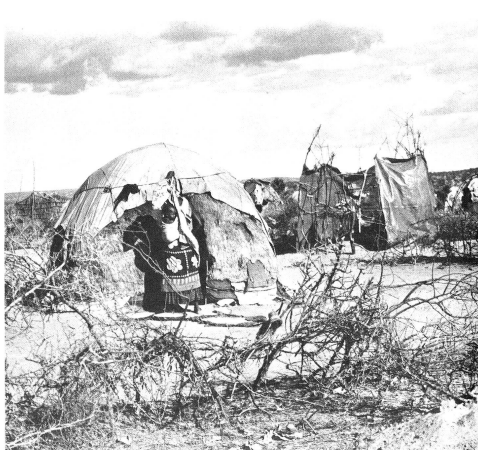
Somalia beherbergt einige hunderttausend Flüchtlinge. Im Lager Maganay pflegte bis vor kurzem eine medizinische Equipe des SRK die Kranken und unterrichtete Einheimische in Grundpflege.

Unsere Patenschaftsgelder werden für Projekte verwendet, die auf die Selbsthilfe der Flüchtlinge abzielen und deshalb über längere Zeit geführt werden müssen.