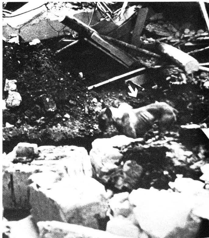
Bukarest 1977: Die K-Hunde konnten auch in den Trümmern von Hochhäusern erfolgreich orten.