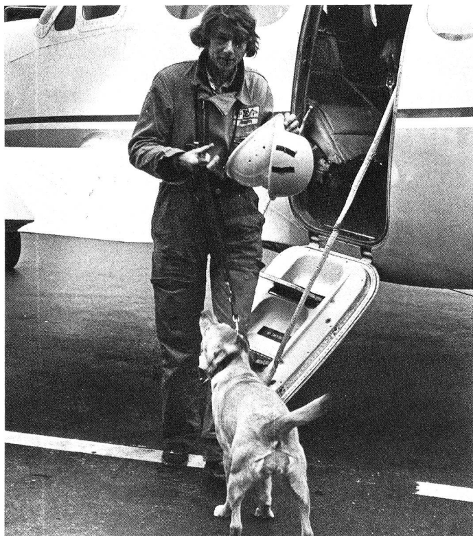
Jugoslawien, 1979: Eine Hundeführerin mit ihrer Labradorhündin vor dem Abflug ins Erdbebengebiet.