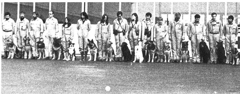
Alarm beim Erdbeben in Iran: Innert 3½ Stunden standen 30 K-Teams auf dem Flughafen Kloten bereit.

«Mensch und Hund als Rettungsteam» durch. Hier soll der methodische Aufbau eines K-Teams dargestellt werden. Das Interesse ist weltweit. Zurzeit bildet der SVKA eine Gruppe von angehenden K-Teams im Auftrag des Schweizerischen Katastrophenhilfskorps in Kolumbien aus, dies in Zusammenarbeit mit dem Zivilschutz der Stadt Cali. Etwas westlich dieser Ortschaft liegt Popayan, das vor Jahresfrist durch ein Erdbeben stark beschädigt worden ist. Man nimmt hier die Aufgabe ernst. Es darf angenommen werden, dass in etwa zwei Jahren eine verlässliche Einsatzgruppe bereitsteht, die dann ganz Lateinamerika zur Verfügung stehen wird.