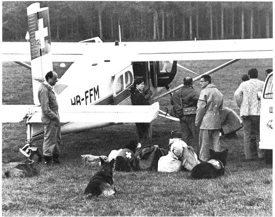
Eine Equipe wird ins Erdbebengebiet von Friaul geflogen (1976). Dank den K-Hunden konnten 16 Menschen lebend geborgen werden.