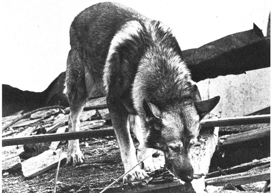
Die Hundennase ist ein unerhört leistungsfähiger Geruchsdetektor. Der K-Hund spürt damit die aus der Tiefe aufsteigende Witterung Verschütteter auf.