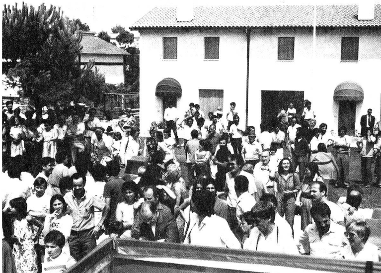
In Torella dei Lombardi wurde die Einweihung der Siedlung mit einem Volksfest gefeiert. Im Hintergrund ein Teil der neuen Siedlung.

Lombardi, die als Gemeinschaftsprojekt SRK/Bund von der Glückskette mitunterstützt wurde, Finanzhilfe leisteten dabei auch das «Badener Tagblatt» und der «Corrieri del Ticino». Nach Überwindung unzähliger Formalitäten erfolgte der erste Spatenstich im Mai 1983. Die Wohnsiedlung wurde nach Kriterien des sozialen Wohnungsbaus erstellt und bietet jenen Menschen ein neues Zuhause, die vor