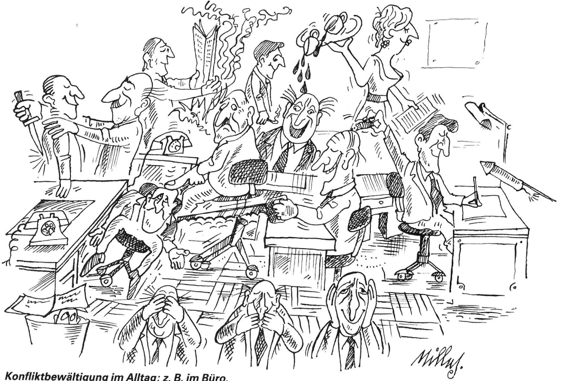
Konfliktbewätigung im Alltag: z. B. im Büro.

Publikation John Millns: «Die Schweiz durchleuchtet», Verlag und Druck Dietschi AG, Olten.