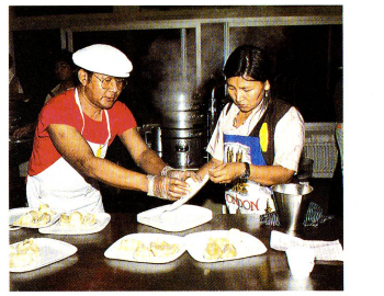
Selbst die Essenstradition hat sich fern von der Heimat erhalten. Hier entstehen «mormos», eine Art von riesigen, gefüllten Rivoli.

landschaften, diese Dörfer, die sich um ein Kloster drängen. Ob sie wohl Heimweh haben? Auf unsere Frage hin bleiben ihre Mienen undrückend. Werden sie ihre Bräuche, ihre Traditionen, ihre Religion bewahren können? Die Frage ist berechtigt. Heutzutage gibt es in der Ostschweiz, wo fast alle Schweizer Exiltiber leben, genauer gesagt in Rikon,