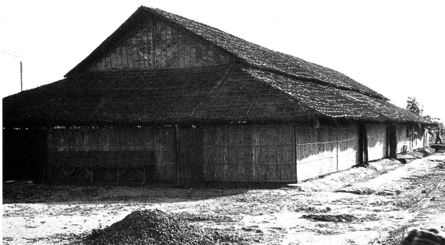
Das SRK-Spital im Flüchtlingslager Khao-I-Dang. In diesem Lager an der thailändisch-kambodschanischen Grenze leben rund 45 000 Menschen.