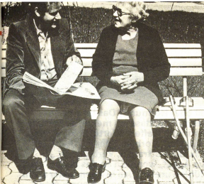
...als Mann sich für eine ältere Zeitgenossin Müsse für eine Plauderei zu nehmen...

cher soziale Probleme auftreten, desto weniger ist der Einsatz von Laien gerechtfertigt.