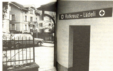
Das Rotkreuz-Lädli in Chur ist ein relativ junges Kind der Sektion. Hier werden minderbemittelte Personen Kleider abgegeben.