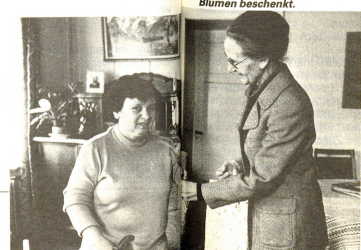
Regelmässig werden durch SRK-Mitarbeiter behinderte und chronisch kranke Leute mit Blumen beschenkt.