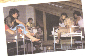
Am Rand der vollgegrüteten Tage kommen weder Unterhaltung noch Gespräche zu kurz.

das originale Namensschild an den T-Shirt. Andere wiederum begannen ihren Einstieg zum zentralen Thema mit der Visionierung des Filmes «Helfen, mein Beruf», der vom Schweizerischen Roten Kreuz produziert worden ist. Überall Gruppenarbeit. Da wurde das spielerische Umgehen mit Gips erlernt, dort dekorierten Burschen und Mädchen gemeinsam die Disco.