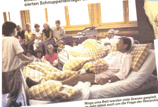
Rings ums Bett werden viele Szenen gespielt, es geht dabei auch um die Frage der Hierarchie.

Rund 170 Jugendliche aus der ganzen Schweiz, im Alter zwischen 15 und 16 Jahren, wollten es wissen. Zwischen dem 25. Juli und 3. August nahmen sie an einem vom Schweizerischen Roten Kreuz organisierten Schnupperlehrlager (dem 16.) – in Lenk teil.